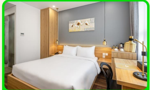
พักเมืองดานัง 4 ดาว 3 คืน