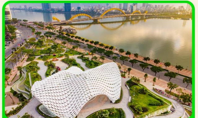
เช็คอิน แหล่งที่เที่ยงใหม่ APEC PARK