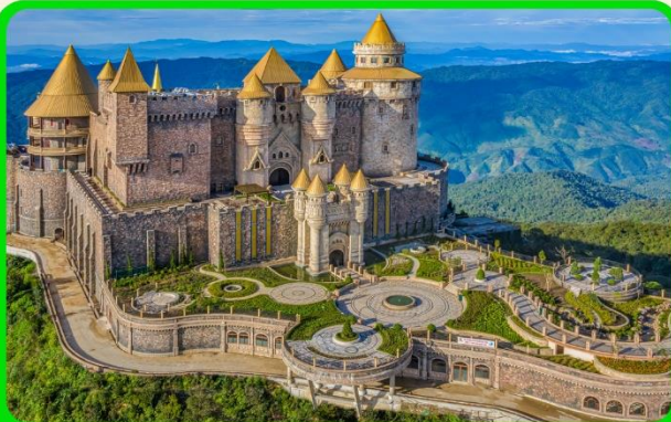
เที่ยวบานาฮิลล์แบบจุใจ เต็มวัน