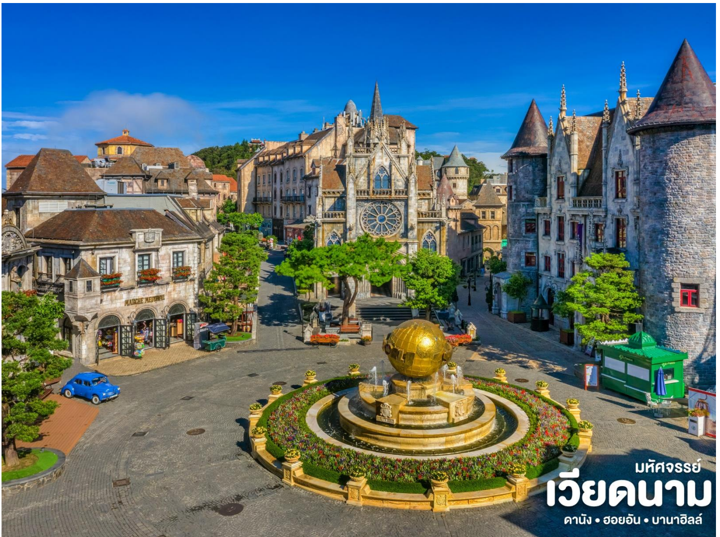
มหัศจรรย์ เว็ียดนาม คานัง • ฮอยอัน • บานาฮิลล์