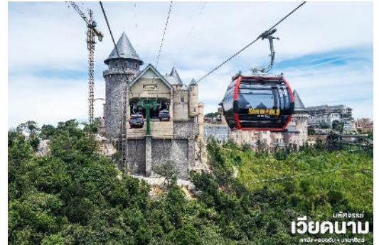
เบ็ลฟรเ็นด์ ฮอลิเดย์ เว็ียดนาม

และบางจุดมีเมฆลอยต่ำกว่ากระเช้าพร้อมอากาศบริสุทธิ์อันสดชื่นจนทำให้ท่านอาจลืมไปเสียด้วยซ้ำว่าที่นี่ไม่ใช่ยุโรปเพราะอากาศที่หนาวเย็นเฉลี่ยตลอดทั้งปีประมาณ 10 องศาเท่านั้น