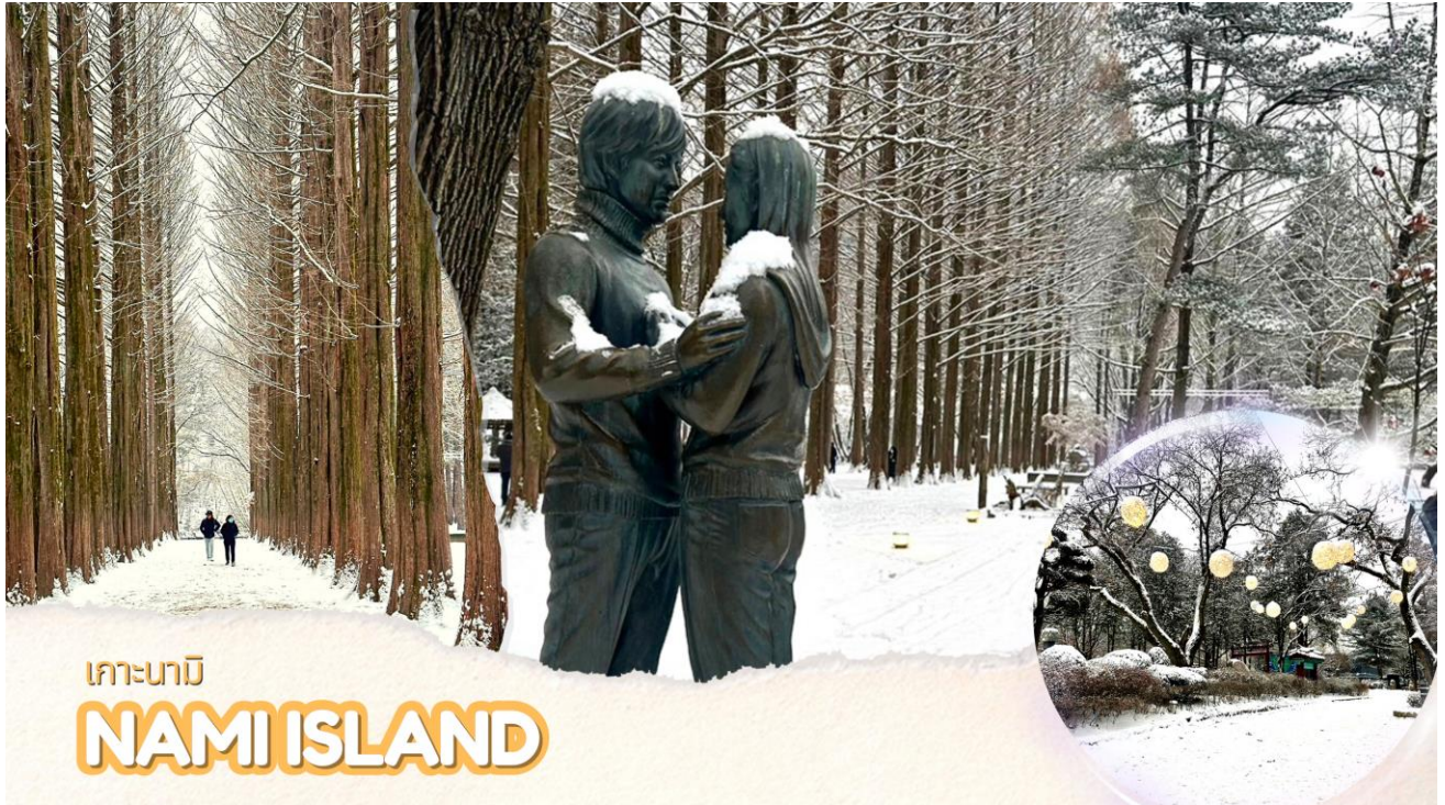
เกาะนามิ NAMI ISLAND

เที่ยง บริการอาหารเที่ยง ณ ร้านอาหาร (มือที่ 1) บริการ ตัดคาลบี หรือไก่บาร์บีคิวผัดซอสเกาหลีอาหารเลี้ยงเชื้อของเมืองซุนซอน โดยนำไก่บาร์บีคิว มันหวาน ผัดกะหล่ำปลี ต้นกระเทียม ต็อกหรือข้าวปั้น และซอสมาผัดรวมกันบนกระทะแบนดำคลุกเคล้าทุกอย่างให้เข้าที่ รับประทานกับผักกาดเกาหลีและเครื่องเคียง