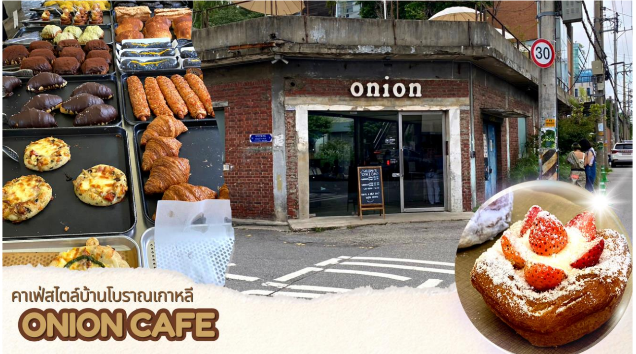
คาเฟ่สไตล์บ้านโบราณเกาหลี ONION CAFE

มีความโมเดิร์น มีที่นั่งเยอะ แต่ต้องมาเช้าๆ เพราะช่วงสายคนจะเยอะมาก ไฮไลท์ - ขนมปังโรยไอซิ่ง หน้าตาเหมือนภูเขาไฟที่ใครมาก็ต้องสั่งอร่อยมากค่ะ เนื้อขนมปังนุ่ม ไม่ได้แข็งอย่างที่คิดทานคู่กับไอซิ่งคือดี