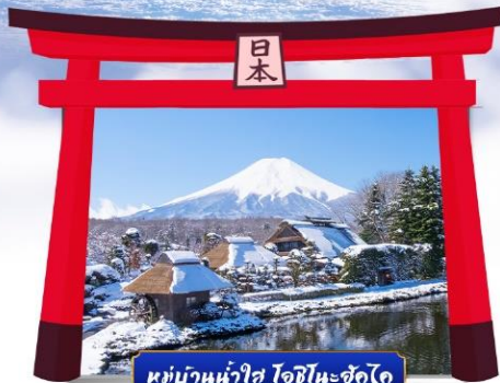
หมู่บ้านน้ำใส โอชิโนะซังได