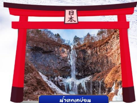
น้ำตกเคงอน