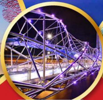
สะพานเกลียวเฮลิคซ์