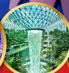
สนามบินชางจี