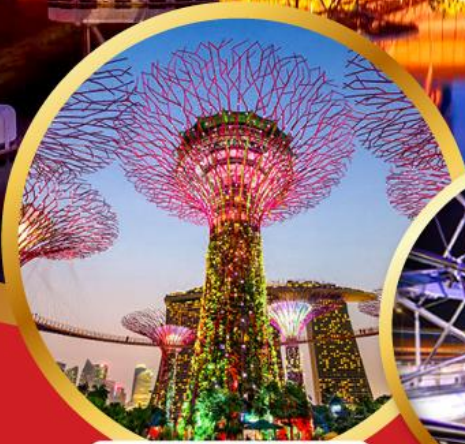
การ์เด็นส์ บาย เดอะ เบย์