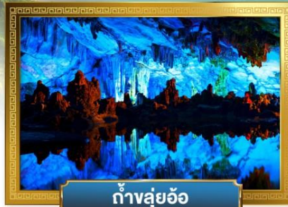
ถ้ำลุย้อ