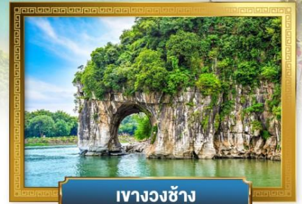
เหวางวงซ้าง