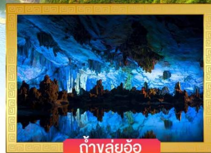
ถ้ำหลุยอ้อ