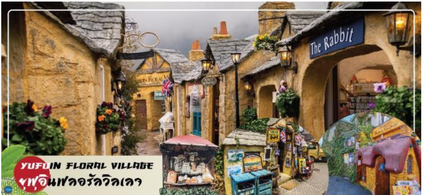
YUFUIN FLORAL VILLAGE หมู่บ้านฟลอรัลวิลเลจ