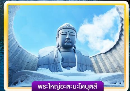
พระใหญ่อะตะมะโดบุตสึ