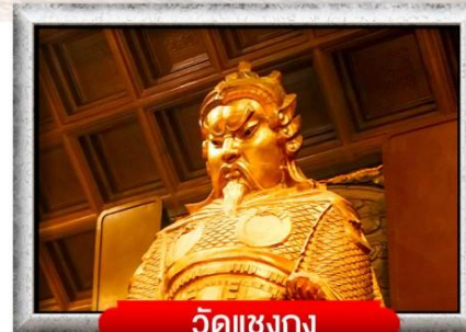
วัดเซ่งก้ง