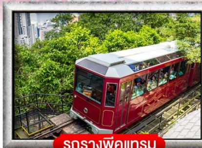
รถรางพิกแครม