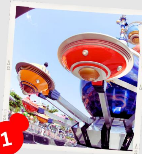
MAIN STREET USA