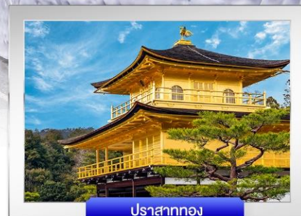
ปราสาททอง