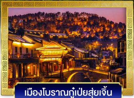
เมืองโบราณกุ่เป่ย์สู่ยเจิ้น