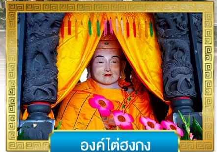
องค์ไตองกง