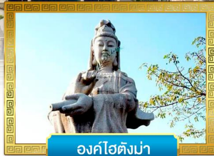
องค์ไร่ดงมา