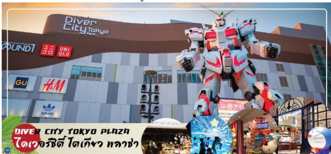
DIVER CITY TOKYO PLAZA ไดเวอร์ซิตี โตเกียว พลาซ่า

เดินทางสู่ ย่านโอไดบะ (Odaiba) (ใช้เวลาเดินทางประมาณ 40 นาที) คือเกาะที่สร้างขึ้นไว้เป็นแหล่งช้อปปิ้ง และแหล่งบันเทิงต่างๆ ในอ่าวโตเกียว ได้รับการปรับปรุงให้มีชื่อเสียงและเป็นที่ยอมรับในช่วงหลังของปี 1990 นอกจากนี้มีสถาปัตยกรรมที่สวยงามตั้งอยู่มากมายแล้ว แต่ก็ยังคงความเป็นธรรมชาติไว้ด้วยความอุดมสมบูรณ์ของพื้นที่สีเขียว ไดเวอร์ซิตี โตเกียว พลาซ่า (Diver City Tokyo Plaza) เป็นห้างดังอีกห้างหนึ่ง ที่อยู่บนเกาะ โอไดบะ จุดเด่นของห้างนี้ก็คือ หุ่นยนต์กันดั้มขนาดเท่าของจริง ซึ่งมีขนาดใหญ่มาก ในบริเวณห้าง อิสระช้อปปิ้งตามอัธยาศัย