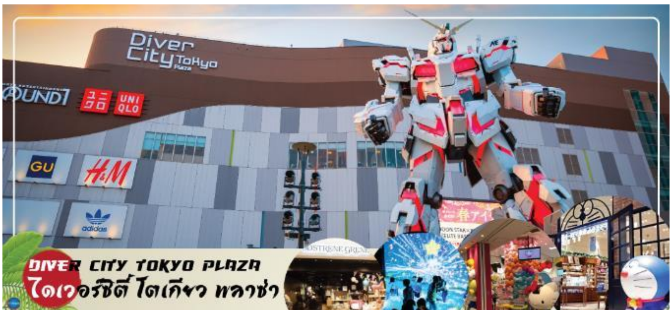
DIVER CITY TOKYO PLAZA ไดเวอร์ซิตี โตเกียว พลาซ่า

เดินทางสู่ ย่านโอไดบะ (Odaiba) (ใช้เวลาเดินทางประมาณ 40 นาที) คือเกาะที่สร้างขึ้นไว้เป็น แหล่งช้อปปิ้ง และแหล่งบันเทิงต่างๆ ในอ่าวโตเกียว ได้รับการปรับปรุงให้มีชื่อเสียงและเป็นที่ยอมรับ ในช่วงหลังของปี 1990 นอกจากนี้มีสถาปัตยกรรมที่สวยงามตั้งอยู่มากมายแล้ว แต่ก็ยังคงความเป็น ธรรมชาติไว้ด้วยความอุดมสมบูรณ์ของพื้นที่สีเขียว ไดเวอร์ซิตี โตเกียว พลาซ่า (Diver City