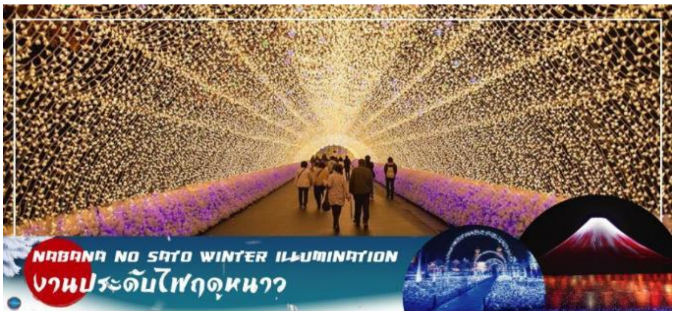
NABANA NO SATO WINTER ILLUMINATION งานประดับไฟฤดูหนาว

ชม งานประดับไฟฤดูหนาว ณ หมู่บ้านนาบะ โนะ ซาโตะ (Nabana no Sato Winter Illumination) เป็นธีมพาร์คสวนดอกไม้ ที่มีทุ่งดอกไม้ให้ชมตลอดทั้ง 4 ฤดูกาล สามารถเที่ยวได้ตลอดทั้งปี ไฮไลท์!!! การประดับไฟขนาดใหญ่ที่สุดในญี่ปุ่น จะมีในช่วงฤดูใบไม้ร่วงตลอดจนถึงปลายฤดูหนาว (ตุลาคม-มีนาคม) จะได้รับความนิยมมากเป็นพิเศษ เนื่องจากมี การแสดงไฟในหลากหลายรูปแบบ ไม่ว่าจะเป็น อุโมงค์แสงไฟ (Tunnel of Light) หรือ การประดับไฟในน้ำ (Water