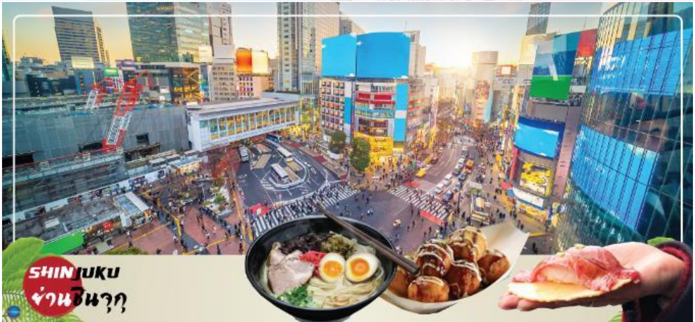
SHINJUKU ย่านชินจุกุ

นำท่านช้อปปิ้ง ย่านช้อปปิ้งชินจุกุ (Shinjuku) (ใช้เวลาเดินทางประมาณ 2 ชั่วโมง) ให้ท่านอิสระ และเพลิดเพลินกับการช้อปปิ้งสินค้ามากมายทั้งเครื่องใช้ไฟฟ้า กล้องถ่ายรูปดิจิทัล นาฬิกา เครื่องเล่นเกม หรือสินค้าที่จะเอาใจคุณผู้หญิงด้วย กระเป๋า รองเท้า เสื้อผ้า แบรินด์เนม เสื้อผ้า แฟชั่นสำหรับวัยรุ่น เครื่องสำอางยี่ห้อดังของญี่ปุ่นไม่ว่าจะเป็น KOSE, KANEBO, SK II, SHISEDO และอื่นๆ อีกมากมาย ห้ามพลาด!!! จุดเช็คอินแห่งใหม่ของชาวโซเชียล นั่นก็คือ แมวยักษ์ 3 มิติ ที่โผล่บนจอแอลอีดีมีขนาดมหึมา จอมีความโค้งขนาด 154 ตารางเมตร (1,664 ตารางฟุต) เสียงที่ออกจากลำโพงคุณภาพเกรดดี ความละเอียดภาพระดับ 4K ถือเป็นเทคโนโลยีระดับสูง ที่ให้ภาพเสมือนจริงปรากฏเป็นภาพแมวเหมียวเดินเล่นไปมาอยู่เหนือกรุงโตเกียว นอกจากนี้แมวยักษ์แล้ว ท่านยังสามารถชมโฆษณาต่างๆ ที่ถูกครีเอทให้เป็นภาพ 3 มิติผ่านจอแอลอีดีนี้ ไม่ว่าจะเป็น แพนด้า, รองเท้าไนกี้, น้องหมา Pompompurin, จานบิน UFO แม้แต่ หุ่นยนต์เครื่องดูดฝุ่น ท่านสามารถชมและเก็บภาพได้ตามอัธยาศัย