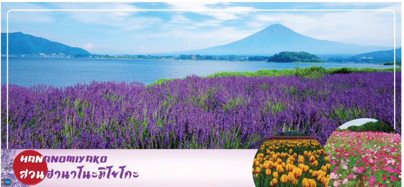
HANANOMIYAKO สวนฮานาโนะมิยาโกะ

เมืองยามานาชิ – สวนดอกไม้ฮานะโนะมียาโกะ หรือ เทศกาลชมดอกกลางเวนเดอร์ที่ทะเลสาบคาวากุจิ (ตามฤดูกาล) – พิธีซิงซางูญี่ปุ่น – กรุงโตเกียว – ย่านโอไดบะ – ห้างไดเวอร์ซิตี – เมืองนาริตะ – อีออนมอลล์ นาริตะ