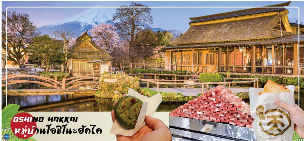
OSHINO HAKKAI หมู่บ้านโอชิโนะฮัคไค

นำท่านเข้าสู่ที่พัก (ใช้เวลาเดินทางประมาณ 20 นาที)