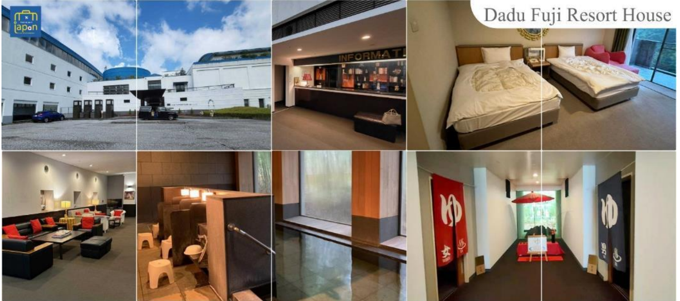
Dadu Fuji Resort House

หลังอาหารให้ท่านได้ผ่อนคลายกับการแช่น้ำแร่ธรรมชาติ เชื่อว่าถ้าได้แช่น้ำแร่แล้ว จะทำให้ผิวพรรณสวยงามและช่วยให้ระบบหมุนเวียนโลหิตดีขึ้น