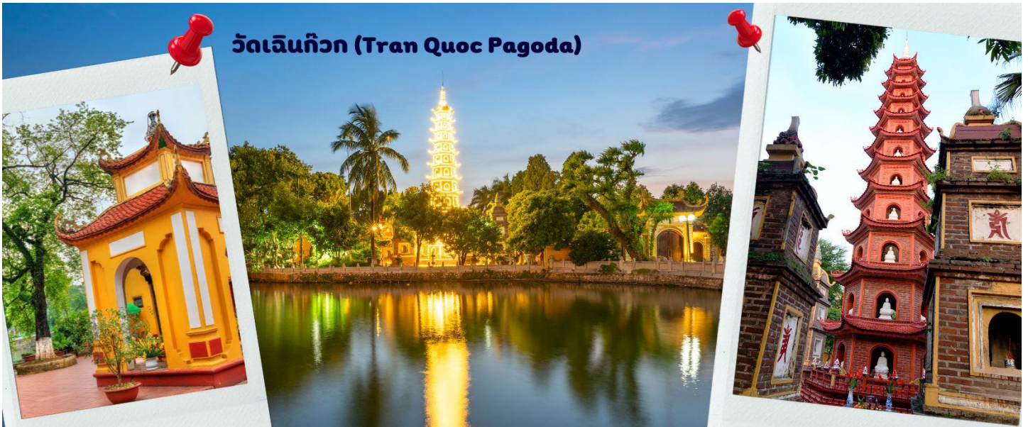
วัดเจรินก๊วก (Tran Quoc Pagoda)

จากนั้นนำท่านไป วัดเจรินก๊วก (Tran Quoc Pagoda) เป็นวัดที่อยู่ใจกลางเมืองของเวียดนาม ใกล้ชิดกับทะเลสาบตะวันตกของเมืองฮานอย สร้างด้วยสถาปัตยกรรมจีนโบราณ มีความร่มรื่น และบรรยากาศดี จึงเป็นที่นิยมของนักท่องเที่ยวทั้งที่ชื่นชอบความงามและมีศรัทธาในพระพุทธศาสนา จากภาพมุมสูงของสถานที่ตั้ง ที่นี่เหมือนตั้งอยู่บนเกาะที่ยื่นลงไปในทะเลสาบ แต่มีเส้นทางคมนาคมเข้าถึงที่ สิ่งปลูกสร้างมีการวางผังเป็นอย่างดี ใช้สีสันทึกลมกลืนในโทนสีเหลือง น้ำตาล ตัดกับสีเขียวของต้นไม้ใหญ่ที่โอบล้อมอยู่ในมุมถ่ายภาพจากอีกฝั่งหนึ่ง จะเห็นสิ่งปลูกสร้างสไตล์จีน และเจดีย์หลายชั้นโดดเด่น มีภาพที่สะท้อนลงสู่ผิวน้ำ เป็นภูมิทัศน์ที่งดงามทั้งยามกลางวันและยามค่ำคืนที่มีการเปิดไฟส่องสว่าง