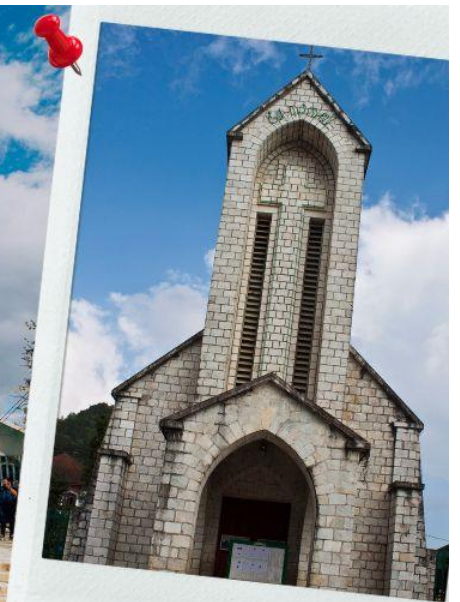
โบสถ์หินแห่งเมืองซาปา (The Ancient Stone Church)

นำท่านช้อปปิ้งที่ ตลาดไนต์เมืองซาปา มีสินค้าให้ท่านเลือกช้อปปิ้งมากมาย ไม่ว่าจะเป็นสินค้าพื้นเมืองของฝัก ขนมห กระเป๋า รองเท้า ท่านสามารถช้อปปิ้งได้อย่างจุใจ