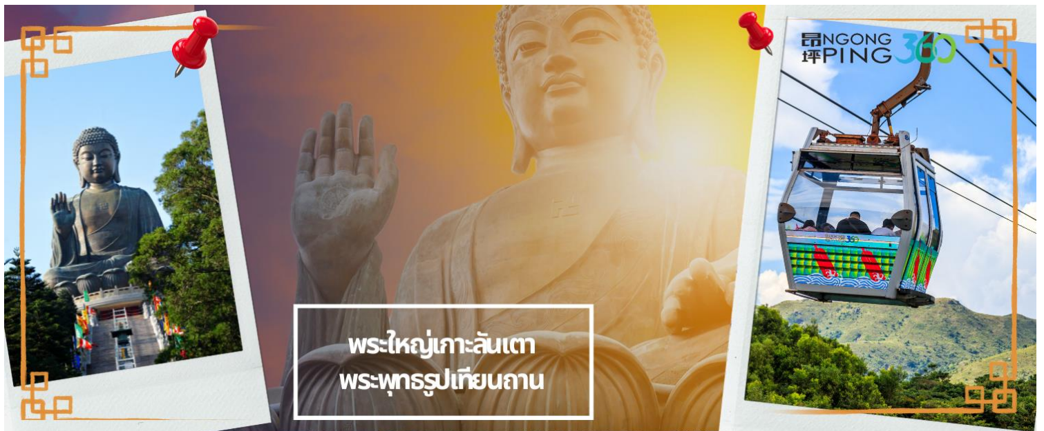
พระใหญ่เกาะลันเตา พระพุทธรูปเทียนถาน