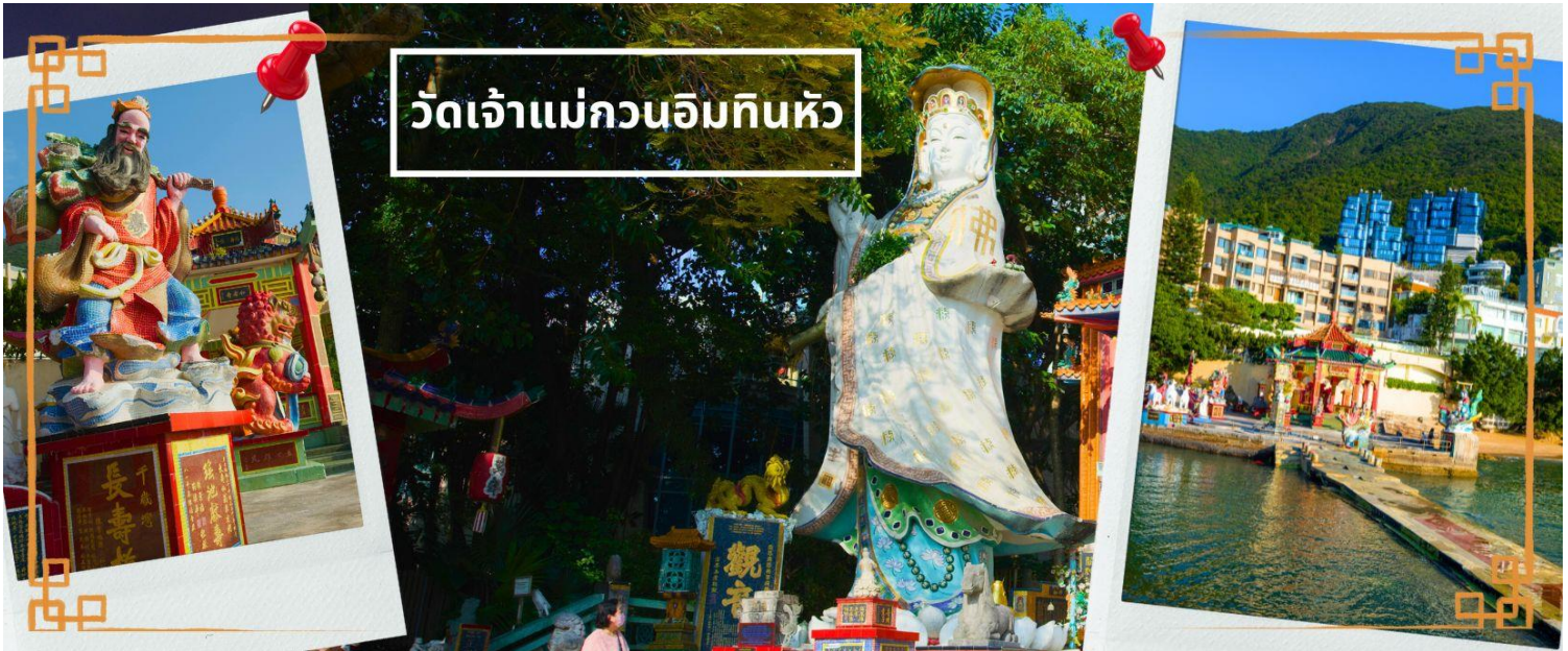
วัดเจ้าแม่กวนอิมกินหัว

จากนั้นนำท่านเดินทางสู่ วัดเจ้าแม่กวนอิมกินหัว อ่าวรีพัลส์เบย์ (TIN HAU TEMPLE REPULSE BAY) ตั้งอยู่ริมทะเล เป็นสถานที่ท่องเที่ยวสำคัญ สร้างขึ้นในปี ค.ศ.1993 วัดแห่งนี้ถูกสร้างขึ้นเพื่อคุ้มครองชาวประมงในการออกเรือไปหาปลา ซึ่งเป็นหนึ่งในวัดที่เก่าแก่ที่สุดของฮ่องกง บริเวณวัดจะมี เจ้าแม่กวนอิมองค์ใหญ่ ปางประทานพรตั้งอยู่ เป็นเทพที่ชาวฮ่องกงและคนจีนให้ความเคารพนับถือมากที่สุด สามารถขอพรได้ทุกอย่าง วัดนี้เป็นที่นิยมมีนักท่องเที่ยวเดินทางมาขอพรกันมากมาย เพราะเชื่อในความศักดิ์สิทธิ์ และยังมี เจ้าแม่ทับทิม หรือ เทพธิดาแห่งท้องทะเลองค์ใหญ่ ซึ่งคนฮ่องกง คนมาเก๊า และคนจีน ที่อยู่ริมทะเล ชาวประมง นักเดินเรือหรือผู้ที่เดินทางทางเรือเป็นประจำ จะนับถือเจ้าแม่ทับทิมเป็นอย่างมาก มีความเชื่อว่าเจ้าแม่ทับทิมจะปกป้องเราจากภัยอันตรายระหว่างการเดินทาง ภายในวัดยังมีเทพเจ้าและพระพุทธรูปต่างๆ ประดิษฐานไว้มากมายตามความเชื่อถือศรัทธา เช่น เทพเจ้าไฉชิงเอี้ย ให้อายุโชคลาภความมั่งคั่ง ความร่ำรวย, พระสังกัจจายน์โพธิสัตว์ เทพประทาน บุตร-ธิดา ให้อธิษฐานขอลูก, สะพานต่ออายุ (สะพานอายุยืน) สะพานสีแดงตั้งอยู่บนริมหาด สีแดงสด เชื่อกันว่า คนจีนเชื่อกันว่าหากเดินข้ามสะพานนี้ เราจะมีอายุยืนขึ้นอีก 3 วัน (3 วัน บนสวรรค์ = 3 ปี บนโลกมนุษย์) นั้นหมายความว่า ถ้าเราเดินข้ามสะพานนี้แล้ว จะมีอายุยืนยาวขึ้นอีก 3 ปี บนโลกมนุษย์, เทพเจ้าแห่งความรัก ให้อายุเนื้อคู่, ศาลา 8 เหลี่ยม เชื่อกันว่าเป็นจุดที่มีดวงจัญดีที่สุดในศาลาแปดเหลี่ยม จุดกึ่งกลางของพื้นจะมีรูปแปดเหลี่ยม ให้เราไปยื่นขอพรจากตำแหน่งนี้เพื่อขอพรหลังจากสวรรค์ และอีกมากมายให้ท่านได้สักการะบูชา