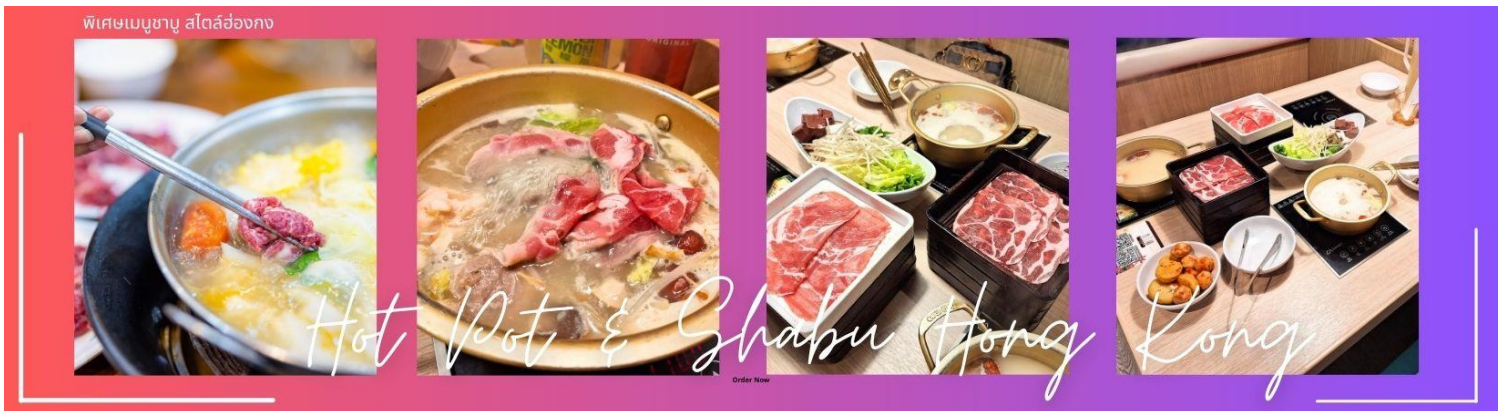
พิเศษเมนูชาบู สไตล์ฮ่องกง

กลางวัน | ๑๐ | บริการอาหารกลางวัน ณ ภัตตาคาร พิเศษเมนูชาบู สไตล์ฮ่องกง (4)