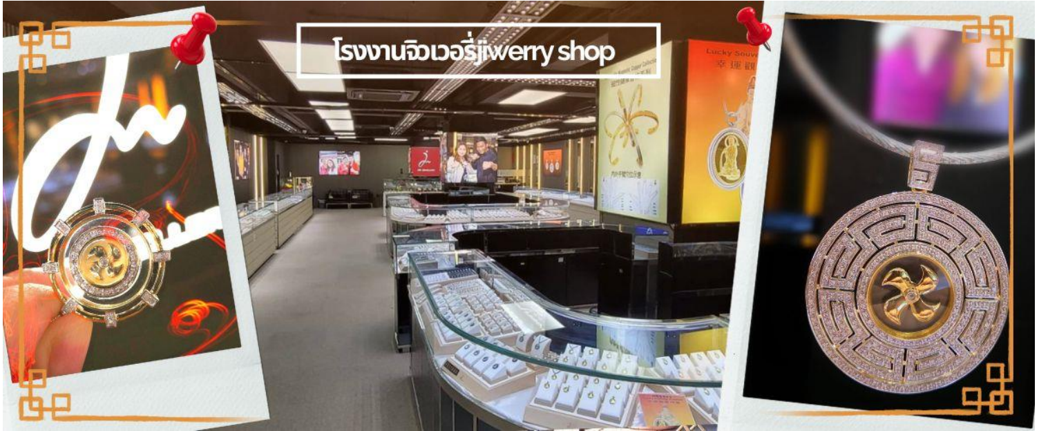
โรงงานจิวเวลรี่ jewelry shop

กลางวัน | ๑๐ | บริการอาหารกลางวัน ณ ภัตตาคาร พิเศษเมนูชาบู สไตล์ฮ่องกง (4)