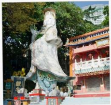
เจ้าแม่กวนอิมริพลัสเบย์