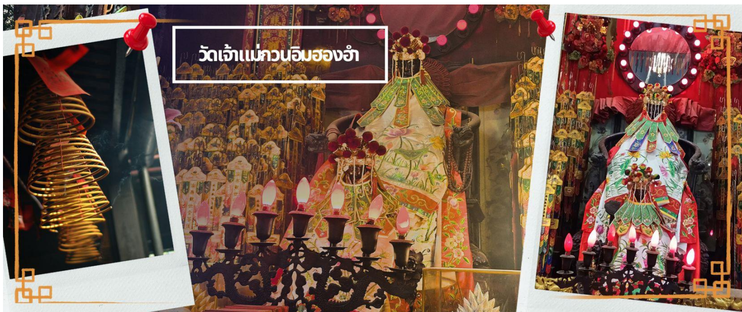
วัดเจ้าแม่กวนอิมสองห้า

จากนั้นนำทุกท่านเดินทางสู่ วัดเจ้าแม่กวนอิมสองห้า (HUNG HOM KWUN YUM TEMPLE) เป็นหนึ่งในวัดที่ชาวฮ่องกงนั้นเลื่อมใสกันมาก ด้วยความที่เจ้าแม่กวนอิมนั้นเป็นเทพเจ้าแห่งความเมตตา ฉะนั้นเมื่อใครมีทุกข์ร้อนอะไรก็มักจะมากราบไหว้ขอพรให้เจ้าแม่ช่วยเหลือ วัดนี้ถูกสร้างขึ้นในปี ค.ศ. 1873 ในช่วงสงครามโลกครั้งที่ 2 มีการปล่อยระเบิดลงบริเวณวัดสองห้าหลายต่อหลายครั้ง ทำให้มีผู้บาดเจ็บและล้มตายมากมาย แต่ชาวบ้านที่หนีเข้าไปหลบภัยในวัดนี้ก็กลับปลอดภัยและตัววัดก็ไม่ได้รับความเสียหายจากเหตุการณ์ทั้งระเบิดอย่างน่าอัศจรรย์ และวันสำคัญอีกวันหนึ่งที่คนหลังไหลมาไหว้ขอพรอย่างไม่ขาดสาย และรอคอยเป็นประจำทุกปี ก็คือ "วันเปิดทรัพย์" หรือ วันยืมเงินเทพเจ้า เป็นวันที่จะมาขอพรและยืมเงินเจ้าแม่กวนอิม ซึ่งตรงกับวันที่ 26 นับจาก