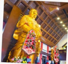
วัดเซกตงกมิม