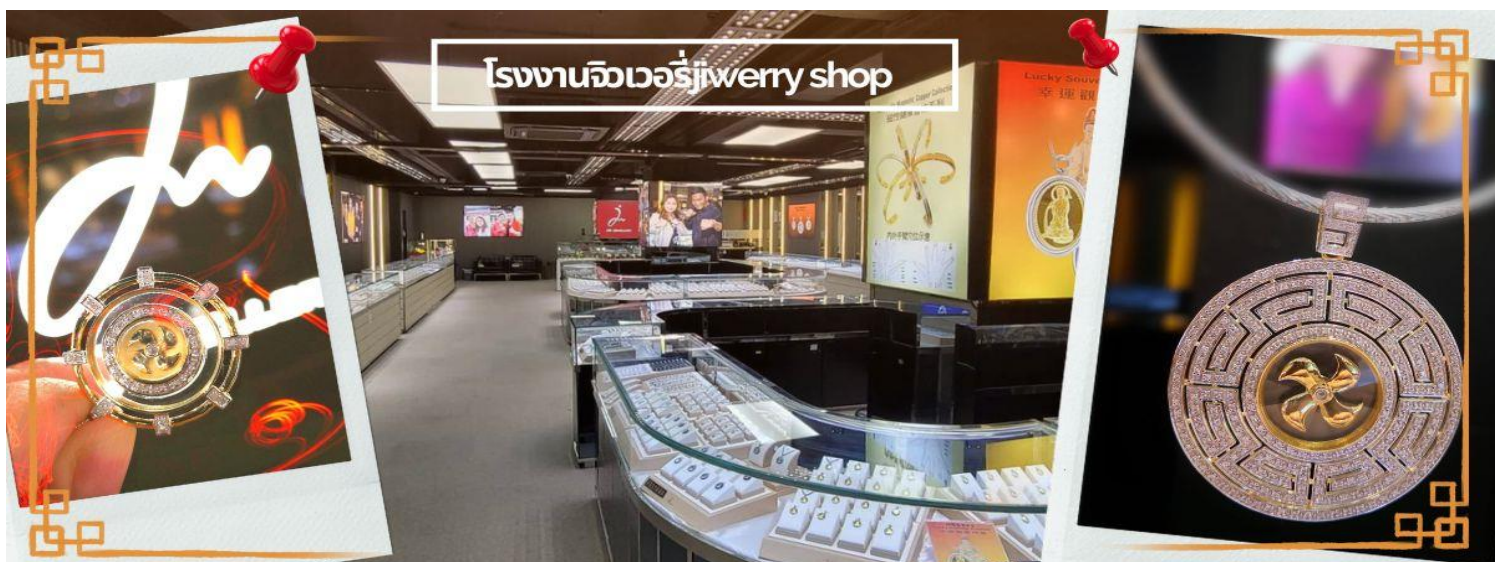
โรงงานจิวเวลรี่jewery shop

วันตรุษจีน ซึ่งพิธีนี้ใน 1 ปี มีเพียงครั้งเดียวเท่านั้นจากนั้น จากนั้นนำท่านชม โรงงานจิวเวลรี่ ซึ่งเป็นโรงงานที่มีชื่อเสียงที่สุดของฮ่องกงในเรื่องการออกแบบเครื่องประดับ อาทิเช่น จี้ และแหวนกำหั้น ที่สวยงามโดดเด่นไม่เหมือนใคร ซึ่งถือกำเนิดขึ้นที่นี่และมีชื่อเสียงที่สุดใช้เป็นเครื่องประดับติดตัว และเสริมดวงชะตา สินค้าทุกชิ้นมีเอกสารรับประกันคุณภาพเปลี่ยน ซ่อม ใต้ตลอดอายุการใช้งาน หากเกิดการชำรุดจากสินค้าไม่ใช่อุบัติเหตุ และ