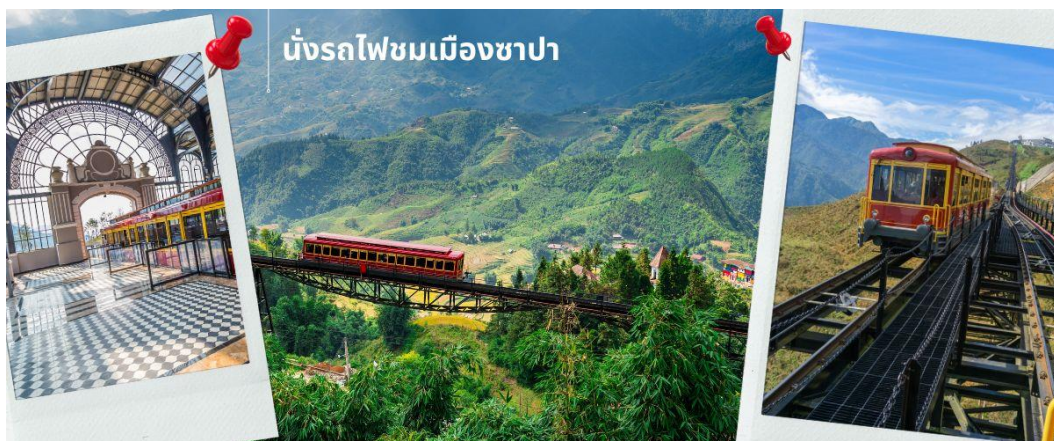
นั่งรถไฟชมเมืองซาปา

นำท่าน นั่งรถไฟชมเมืองซาปา (รวมค่ารถไฟชมเมือง) ท่านจะได้พบกับวิวทิวทัศน์ของเมืองซาปาที่เต็มไปด้วยความสดชื่น และสุดกลิ่นอายธรรมชาติ และยังตื่นตาไปด้วยวิวภูเขา และนาขั้นบันได ที่มีชื่อเสียงของเมืองซาปาอีกด้วย ความยาวประมาณ 2 กิโลเมตร โดยใช้เวลาประมาณ 20 นาทีเพื่อไปสู่สถานีขึ้นกระเช้าที่จะนำท่านขึ้นสู่ยอดเขาฟานซีปัน