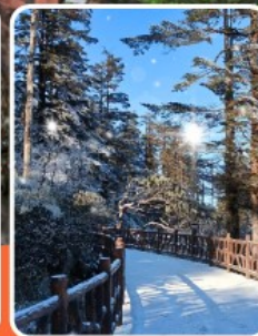
ภูเขาหว่าอูซาน