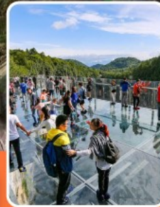
ระเบียงแก้วอุ๋หลง

ภูเขาหว่าอูซาน (รวมขึ้นกระเช้าไป-กลับ) - อุทยานเขานางฟ้า อุทยานหลุมฟ้าสะพานสวรรค์ - ระเบียงแก้วอุ๋หลง - รถไฟฟ้ากะลุดัก หงหยาดัง - วัดเป่ากั๋ว - หลวงพ่อโตเสื่อซาน - วัดต้าฉือ หมี่แพนตั้ยกั๋ย ซ้อปปัง ถนนคนเดินซุนซึซู่ ไท่กู๋หลี่