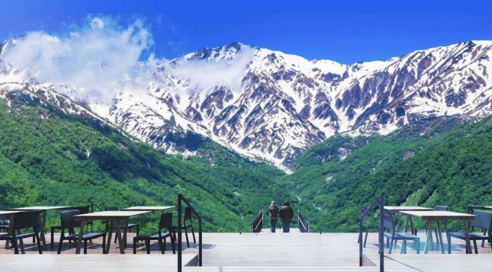
HAKUBA MOUNTAIN HARBOR

ไม่พลาดกับการชมวิวแบบพาโนรามา ณ Hakuba Mountain Harbor ด้วยทัศนียภาพที่เหนือ ชั้นของภูเขาโดยรอบ จุดเด่น คือ ระเบียง “Hakuba Sanzan” ที่สามารถเห็นเทือกเขาแอลป์แบบ 360 องศา ได้อย่างสวยงามในทุกฤดู สามารถยืนถ่ายรูป และดื่มด่ำกับบรรยากาศได้อย่าง เต็มอิม ในบริเวณเดียวกันยังมีร้านเบเกอรี่ โดยทางเข้ามีที่นั่งบนระเบียง สามารถเพลิดเพลิน ไปกับการจิบเครื่องดื่มอุ่น ๆ พร้อมชมบรรยากาศตามอัธยาศัย