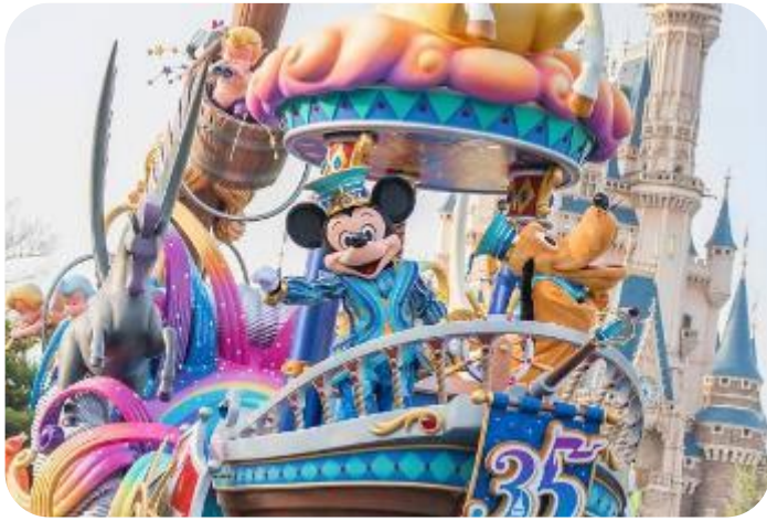
ของดิสนีย์

ภาพยนตร์สามมิติ The Invention of the Year อีกทั้งท่านได้เพลิดเพลินไปกับการเลือกซื้อสินค้าที่ระลึกสุดน่ารักในดิสนีย์แลนด์ ท่านยังจะได้สัมผัสใกล้ชิดกับตัวการ์ตูนเอกจากวอลท์ดิสนีย์ อย่าง มิกกี้ แม้าส์ มินนี่ แม้าส์ พร้อมพองเพื่อนตัวการ์ตูนอีกมากมาย หรือชมขบวน “อิลีคทริคพาเหรด” ซึ่งจะจัดเป็นริ้วขบวนเพื่อแสดงให้นักท่องเที่ยวได้ชมอย่างสวยงาม และอลังการด้วยเครื่องแต่งกายของนักแสดง รวมทั้งตัวการ์ตูนต่าง ๆ