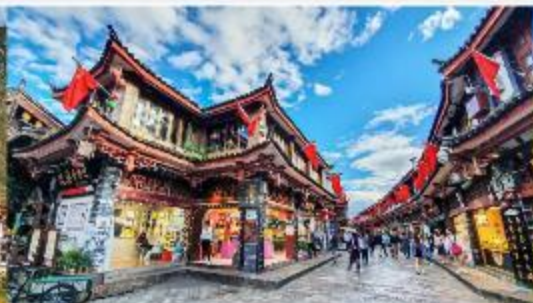
เมืองโบราณสี่เจียง