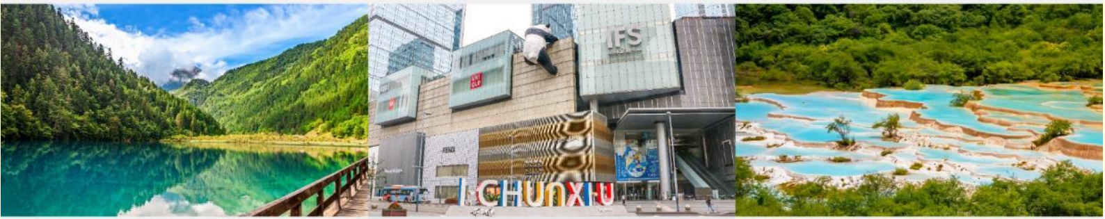
อุทยานจิวอ้ายโก แพนด้ายักษ์บนตึก IFS อุทยานฯหวงหลง