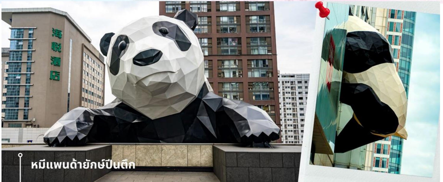
หมีแพนด้ายักษ์ปักกิ่ง

จากนั้นนำเส้นทางไปช้อปปิ้งกันต่อที่ POP MART เป็นหนึ่งในแบรนด์ที่ได้รับความนิยมในประเทศจีน มีกลุ่มสินค้าหลากหลายประเภท รวมถึงของเล่นที่ได้รับความนิยมอย่างสูงในหมู่นักสะสม ความน่าสนใจของ POP MART คือการที่จะได้เก็บสะสมโมเดลที่มีเอกลักษณ์ และสินค้าหลายสาขาในลงซึ่งมีสินค้าพร้อมจำหน่ายโดยไม่ต้องต่อแถวรอคิว สินค้าบางรุ่นมีความหายากและคอลเลกชันพิเศษ เช่น สาย Apple Watch ลานู๊ กระเป๋าผ้าลานู๊ และ Flying Disc ที่อาจไม่มีวางจำหน่ายในไทย