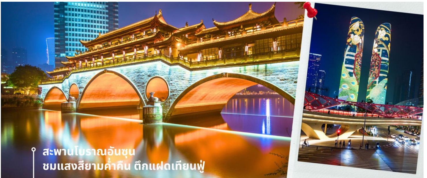
สะพานโบราณอันซุน ชมแสงสียามค่ำคิน ตึกแฝดเทียนฟู่

นำท่านเดินทางสู่ สะพานอันซุน ตั้งตระหง่านเหนือแม่น้ำจิน ใจกลางเมืองเฉิงตู มณฑลเสฉวน ประเทศจีน สะพานหินห้าโค้งแห่งนี้ ไม่ได้เป็นเพียงทางข้ามที่เชื่อมต่อสองฝั่งแม่น้ำเท่านั้น แต่ยังเป็นสัญลักษณ์อันงดงามของเมือง สะท้อนถึงวัฒนธรรม ประวัติศาสตร์ และวิถีชีวิตของชาวเฉิงตูมายาวนานกว่า 300 ปี ด้วยความวิจิตรบรรจงของสถาปัตยกรรมแบบดั้งเดิม สะพานหินแกะสลักประณีต ประดับประดามีกรรมรูปสลักรูปสัตว์ในตำนาน เช่น มังกร สิงโต และฟีนิกซ์ สะท้อนให้เห็นถึงความเชื่อ ศรัทธา และจินตนาการของผู้คนในยุคหนึ่ง สะพานแห่งนี้เปรียบเสมือนเส้นทางข้ามกาลเวลา เชื่อมโยงอดีต ปัจจุบัน และอนาคตเข้าไว้ด้วยกัน ด้วยความงดงามและเสน่ห์อันเป็นเอกลักษณ์ สะพานโบราณกลายเป็นแรงบันดาลใจให้กับศิลปิน นักเขียน และนักดนตรีมากมาย ปรากฏในภาพวาด บทกวี เพลง และภาพยนตร์จีนหลายเรื่อง สะท้อนให้เห็นถึงความสำคัญทางวัฒนธรรมของสะพานแห่งนี้