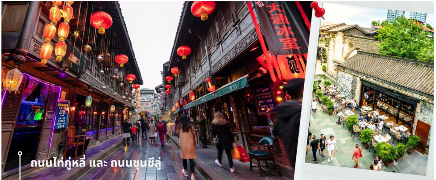
ถนนไท่กุ่หลี่ และ ถนนชุนซีลู่

นำท่านสักการะ วัดต้าฉือ ตั้งอยู่ในใจกลางเมืองเฉิงตู มณฑลเสฉวน ประเทศจีน เป็นวัดพุทธนิกายมหายานที่มีชื่อเสียงโด่งดังและเก่าแก่ที่สุดแห่งหนึ่งในภูมิภาคตะวันตกเฉียงใต้ของจีน อารามแห่งนี้เปี่ยมไปด้วยเสน่ห์ดึงดูดผู้คนจากทั่วโลก ด้วยประวัติศาสตร์อันยาวนานกว่า 1,600 ปี สถาปัตยกรรมอันงดงาม และความศักดิ์สิทธิ์ขององค์พระพุทธรูปมีพื้นที่กว้างขวางกว่า 120 ไร่ ประกอบด้วยอาคารและวิหารต่างๆ มากมาย สถาปัตยกรรมของวัดเป็นแบบจีนโบราณผสมผสานความงดงามของศิลปะสมัยราชวงศ์ถังและซ่ง