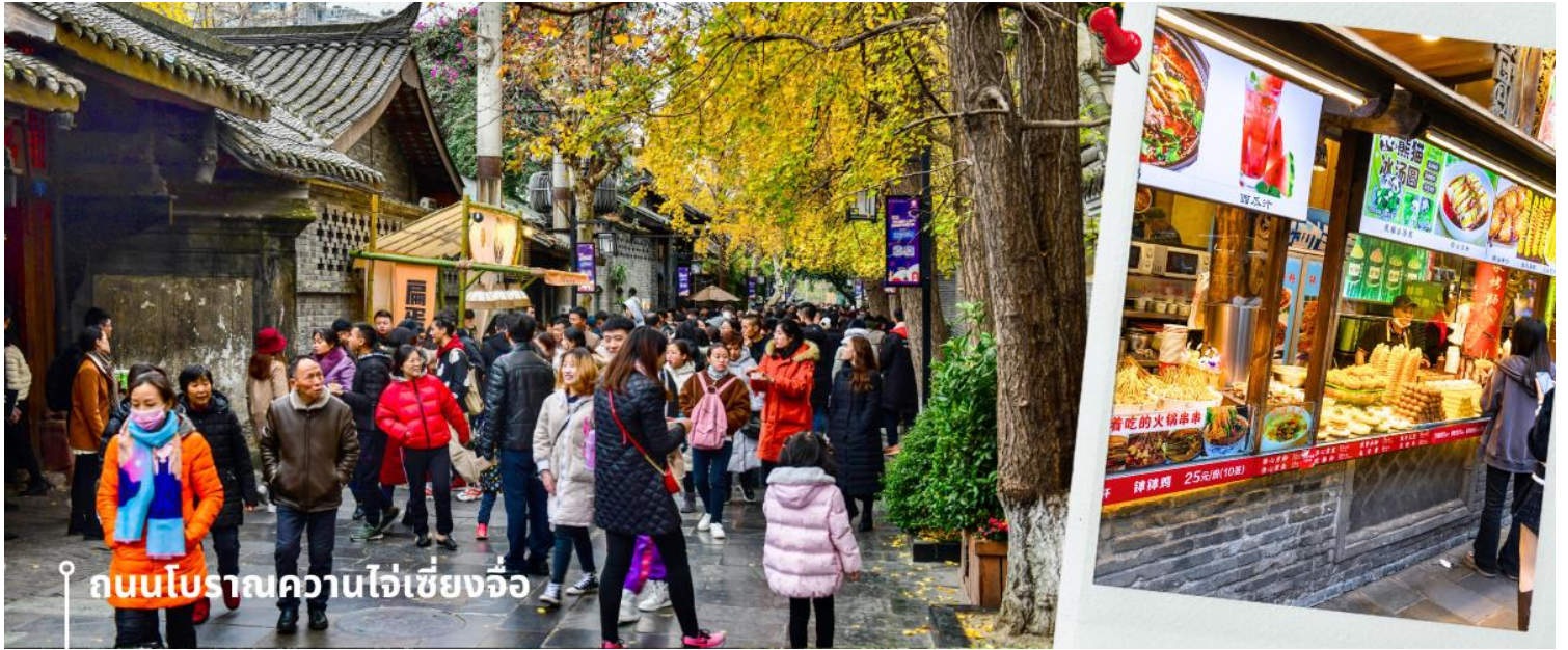
ถนนโบราณความใจ๋เซียงจี้

นำท่านเดินทางสู่ สะพานอันซุน ตั้งตระหง่านเหนือแม่น้ำจิน ใจกลางเมืองเฉิงตู มณฑลเสฉวน ประเทศจีน สะพานหินห้าโค้งแห่งนี้ ไม่ได้เป็นเพียงทางข้ามที่เชื่อมต่อสองฝั่งแม่น้ำเท่านั้น แต่ยังเป็นสัญลักษณ์อันงดงามของเมือง สะท้อนถึงวัฒนธรรม ประวัติศาสตร์ และวิถีชีวิตของชาวเฉิงตูมายาวนานกว่า 300 ปี ด้วยความวิจิตรบรรจงของสถาปัตยกรรมแบบดั้งเดิม สะพานหินแกะสลักประณีต ประดับประดามีกรรมรูปสลักรูปสัตว์ในตำนาน เช่น มังกร สิงโต และฟีนิกซ์ สะท้อนให้เห็นถึงความเชื่อ ศรัทธา และจินตนาการของผู้คนในยุคหนึ่ง สะพานแห่งนี้เปรียบเสมือนเส้นทางข้ามกาลเวลา เชื่อมโยงอดีต ปัจจุบัน และอนาคตเข้าไว้ด้วยกัน ด้วยความงดงามและเสน่ห์อันเป็นเอกลักษณ์ สะพานโบราณกลายเป็นแรงบันดาลใจให้กับศิลปิน นักเขียน และนักดนตรีมากมาย ปรากฏในภาพวาด บทกวี เพลง และภาพยนตร์จีนหลายเรื่อง สะท้อนให้เห็นถึงความสำคัญทางวัฒนธรรมของสะพานแห่งนี้