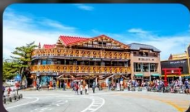
ฟูจิชั้น 5

INTERNATIONAL RESORT HOTEL YURAKUJO MARITA หรือเทียบเท่ามาตรฐานญี่ปุ่น