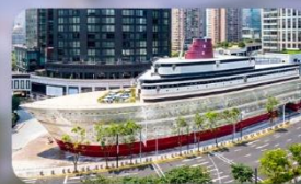
เรือทูลุยส์วิตตอง