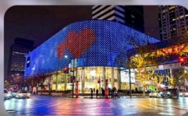
ถนนทวยไห่ลู่