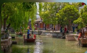
เมืองโบราณจู่เจียเจี้ยว