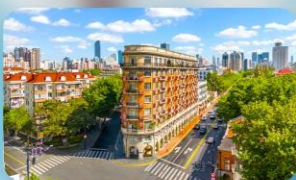
ถนนอันฝู