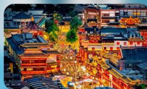
ตลาดร้อยปีเงินหวังเมี่ยว