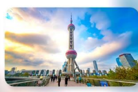
วงเวียนหมิงจู่