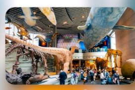
พิพิธภัณฑ์เซี่ยงไฮ้