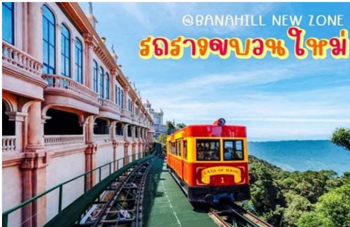
@BANAHILL NEW ZONE รถรางขบวนใหม่