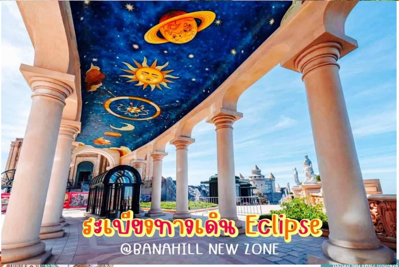
ระเบียงทางเด็ก Eclipse