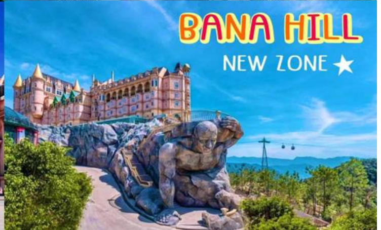
BANA HILL NEW ZONE ★