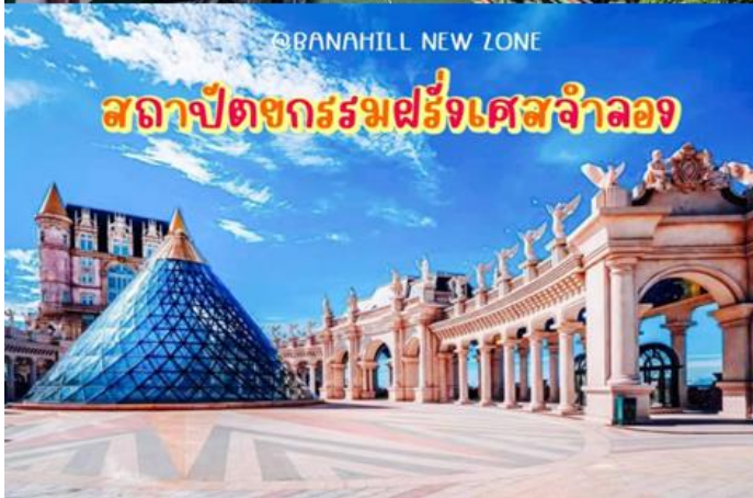
@BANAHILL NEW ZONE สถาปัตยกรรมฝรั่งเศสจำลอง