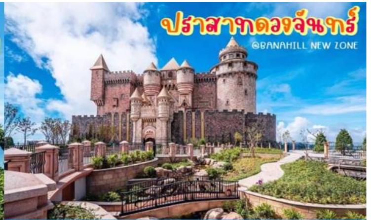
ปราสาทดวงจันทร์ @BANAHILL NEW ZONE