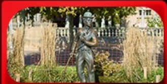
ชาร์ลี แชปลิน