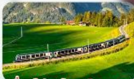
นั้งรถไฟสายโรแมนติก 2 สาย Golden Pass / Luzern Interlaken Express