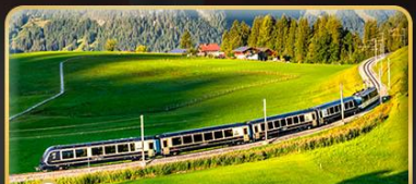
นั่งรถไฟสายโรแมนติก 2 สาย Golden Pass / Luzern Interlaken Express