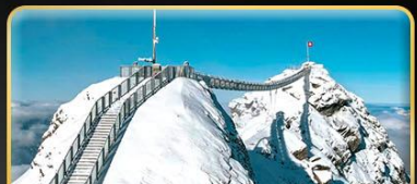
พีชิต 3 ยอดเขาตั้ง Rigi / Schilthorn / Glacier 3000