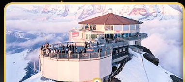
ทานอาหารที่ Piz Gloria ทัศนียภาพที่มองเห็นได้ 360 องศา