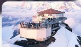
ทานอาหารที่ Piz Gloria ภัตตาคารที่ทูนได้ 360 องศา