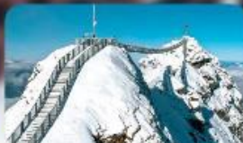
พิชิต 3 ยอดเขาดัง Rigi / Schilthorn / Glacier 3000