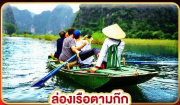
ล่องเรือตามก๊ก