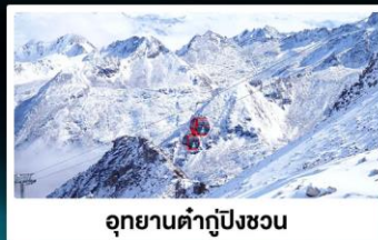
อุทยานคำกู่ปิงชวน