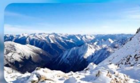
อุทยานคำกู่ปิงชว่น