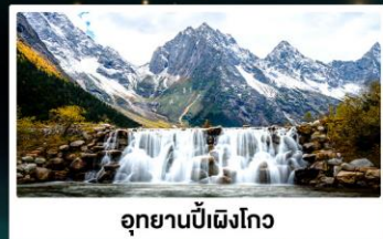
อุทยานปิ่ฝิงโกว