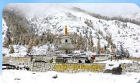
อุทยานกุเวาสีครุณี