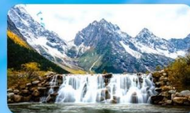
อุทยานปี่ฝิงโกว