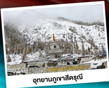
อุทยานกุหาสี่ครุณี