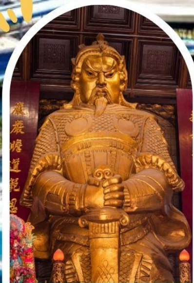
วัดแซกง ขอพรโชคลาก การเงิน และธุรกิจ