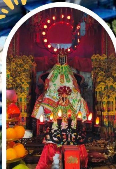
วัดเจ้าแม่กวนอิมฮ่องฮำ ขอพรเรื่องเงิน ทรัพย์สิน และความมั่งคั่ง