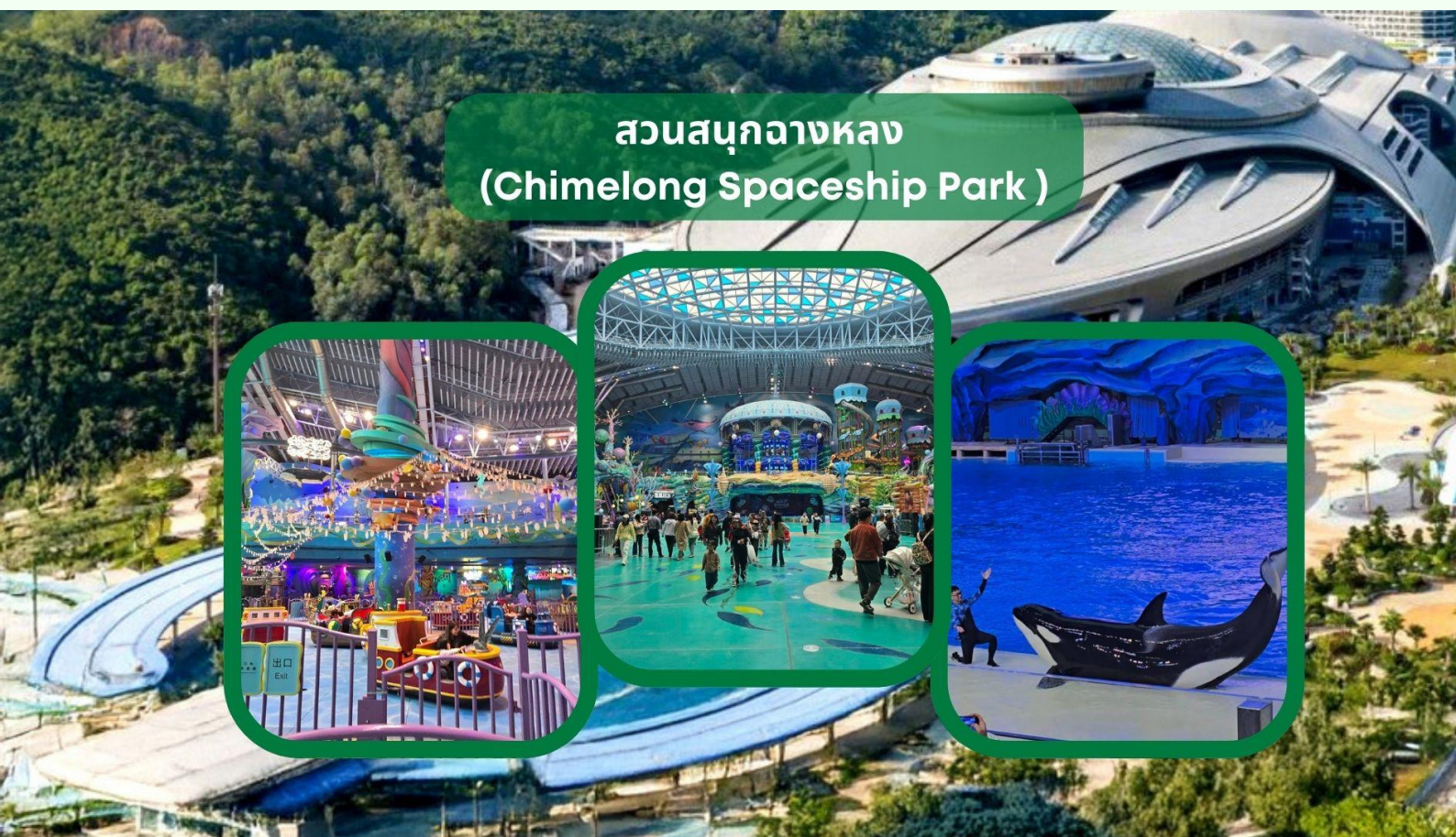
สวนสนุกฉางหลง (Chimelong Spaceship Park)

อิสระอาหารมือเที่ยง และ อาหารมือค่ำ เพื่อไม่ให้เป็นการเสียเวลาในการท่องเที่ยว