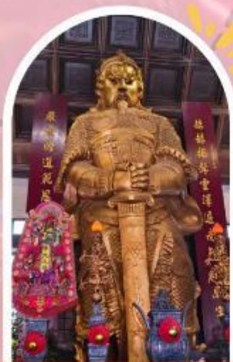
วัดแซกง ขอพรโชคกลาง การเงิน และธุรกิจ