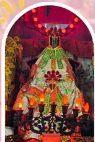
วัดเจ้าแม่กวนอิมฮ่องกง ขอพรเรื่องเงิน ทรัพย์สิน และความมั่งคั่ง