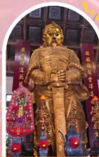
วัดแซกง ขอพรโชคลาก การเงิน และธุรกิจ