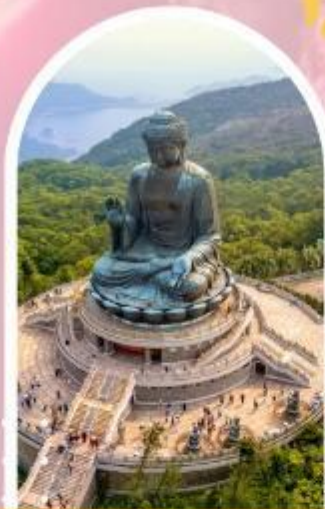
นั่งกระเชานองปิง นมัสการพระใหญ่โป่วหลิน