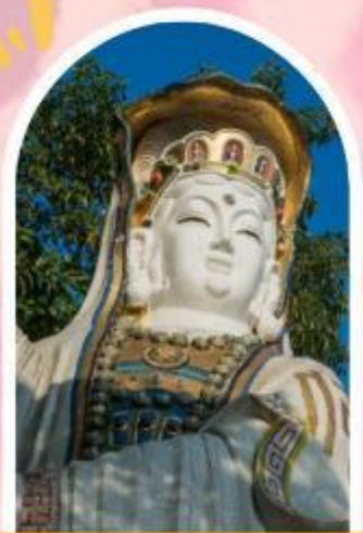
ริพลัสเบย์ รับพลังงานดี เสริมพลังดวงจัญ