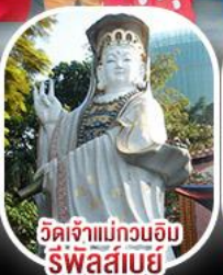
วัดเจ้าแม่กวนอิม รีพัลส์เบย์