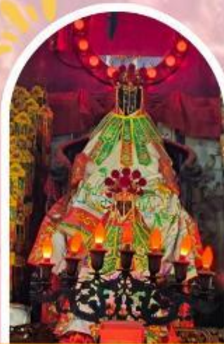
วัดเจ้าแม่กวนอิมฮ่องกง ขอพรเรื่องเงิน ทรัพย์สิน และความมั่งคั่ง