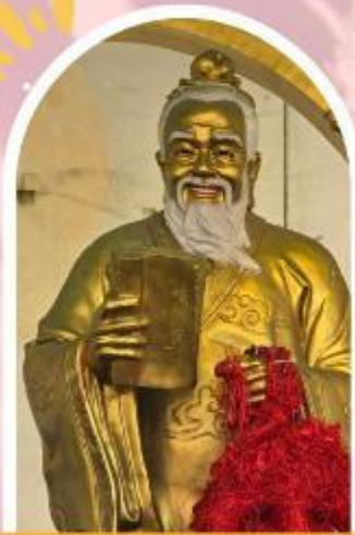
วัดหวังต้าเซียน ขอพรสุขภาพ ความรัก