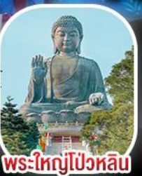
พระใหญ่โป่วหลิน