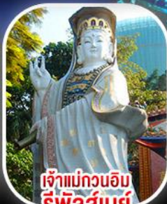
เจ้าแม่กวนอิมรีพัสลันย์