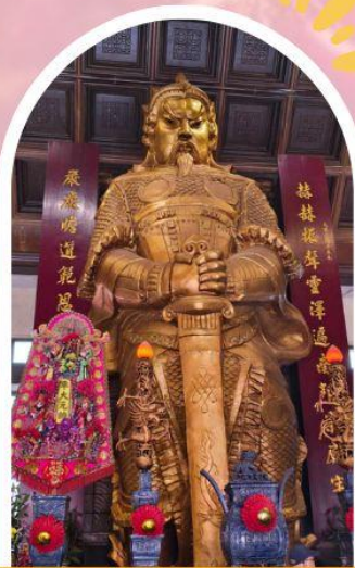
วัดแซกง ขอพรโชคกลาง การเงิน และธุรกิจ