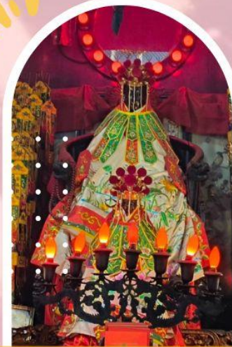
วัดเจ้าแม่กวนอิมฮ่องกง ขอพรเรื่องเงิน ทรัพย์สิน และความมั่งคั่ง