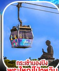
กระเช้าเองปีงพระใหญ่ไผ่ทลีน