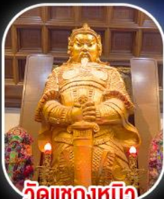
วัดเขกงหนิว