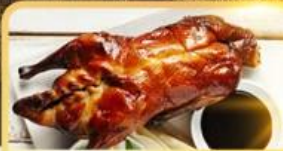
เปิด Four Season