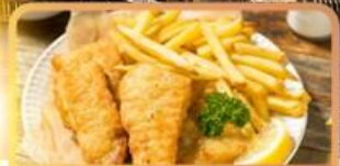
Fish and Chips