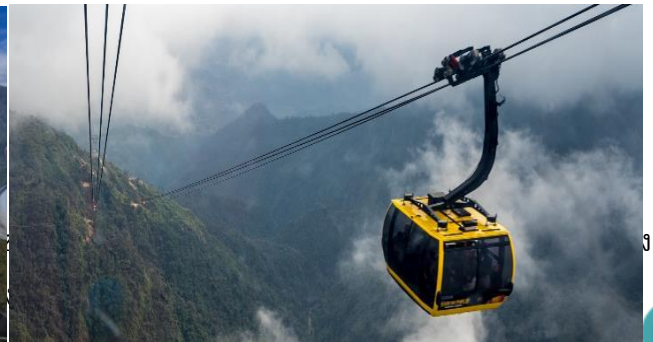
รวมของท่องเที่ยว 11/07424