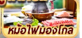
หม้อไฟมองโกล