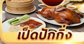
เป็ดปักกิ่ง