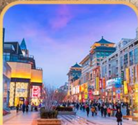
ถนนหวงฟู่จิ่ง