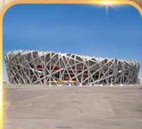
สนามกีฬารังนก