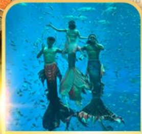
อควาเรียม