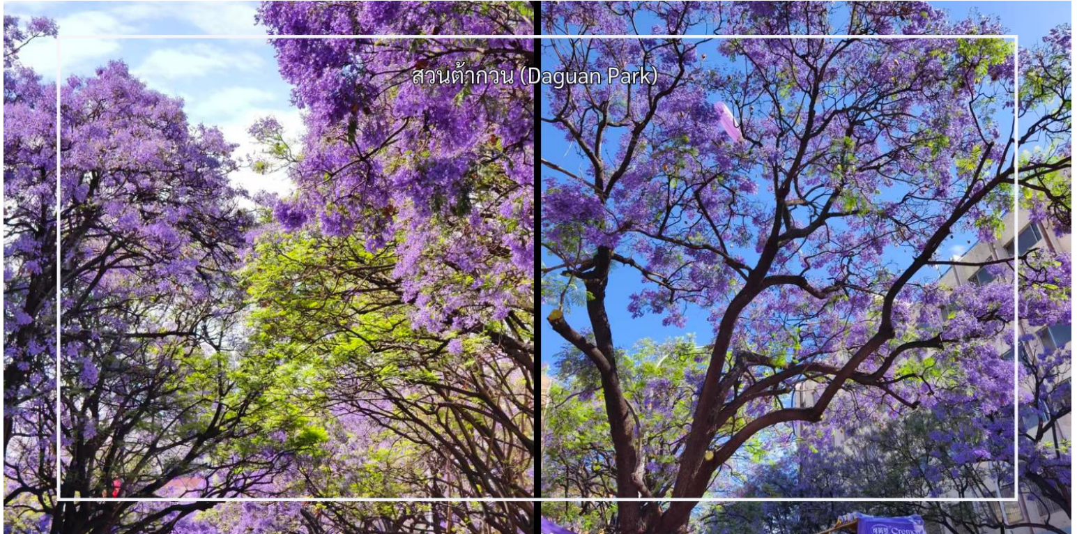
สวนต้ากวน (Daguan Park)