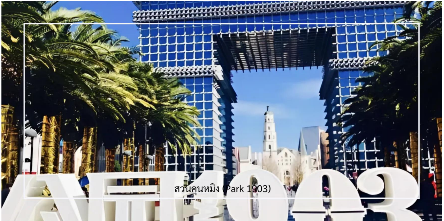
สวนคุณหมิง (Park 1903)