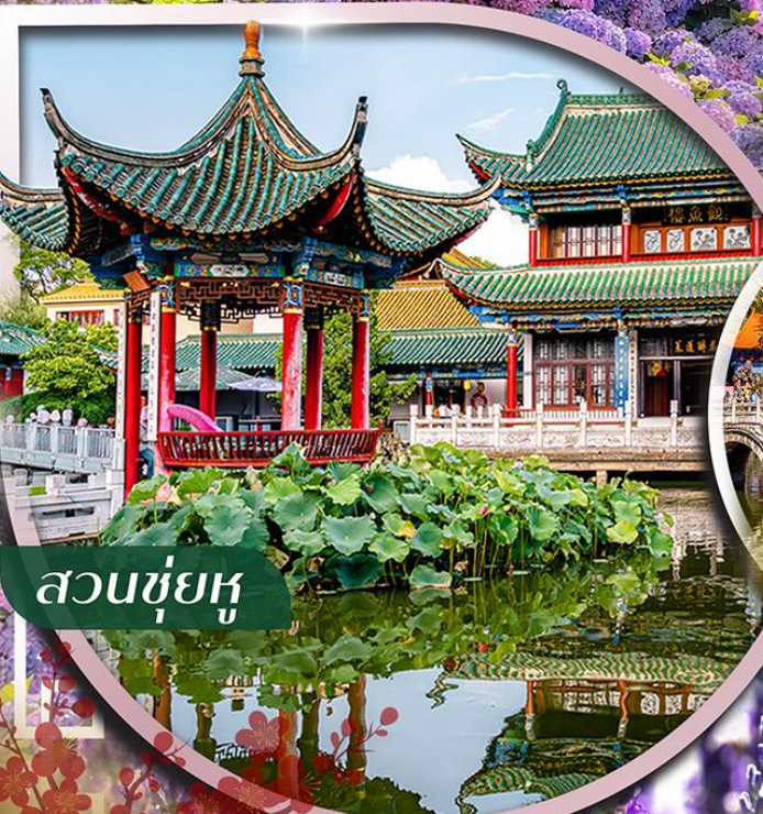
สวนชู่ฮู

ชม กุ้งดอกไม้บานสะพรั่ง ที่สวนลาวยูเหอ และ สวนต้ากวน ตื่นตาไปกับสวนน้ำตกคุณหมิงอันอลังการ ใจกลางเมือง