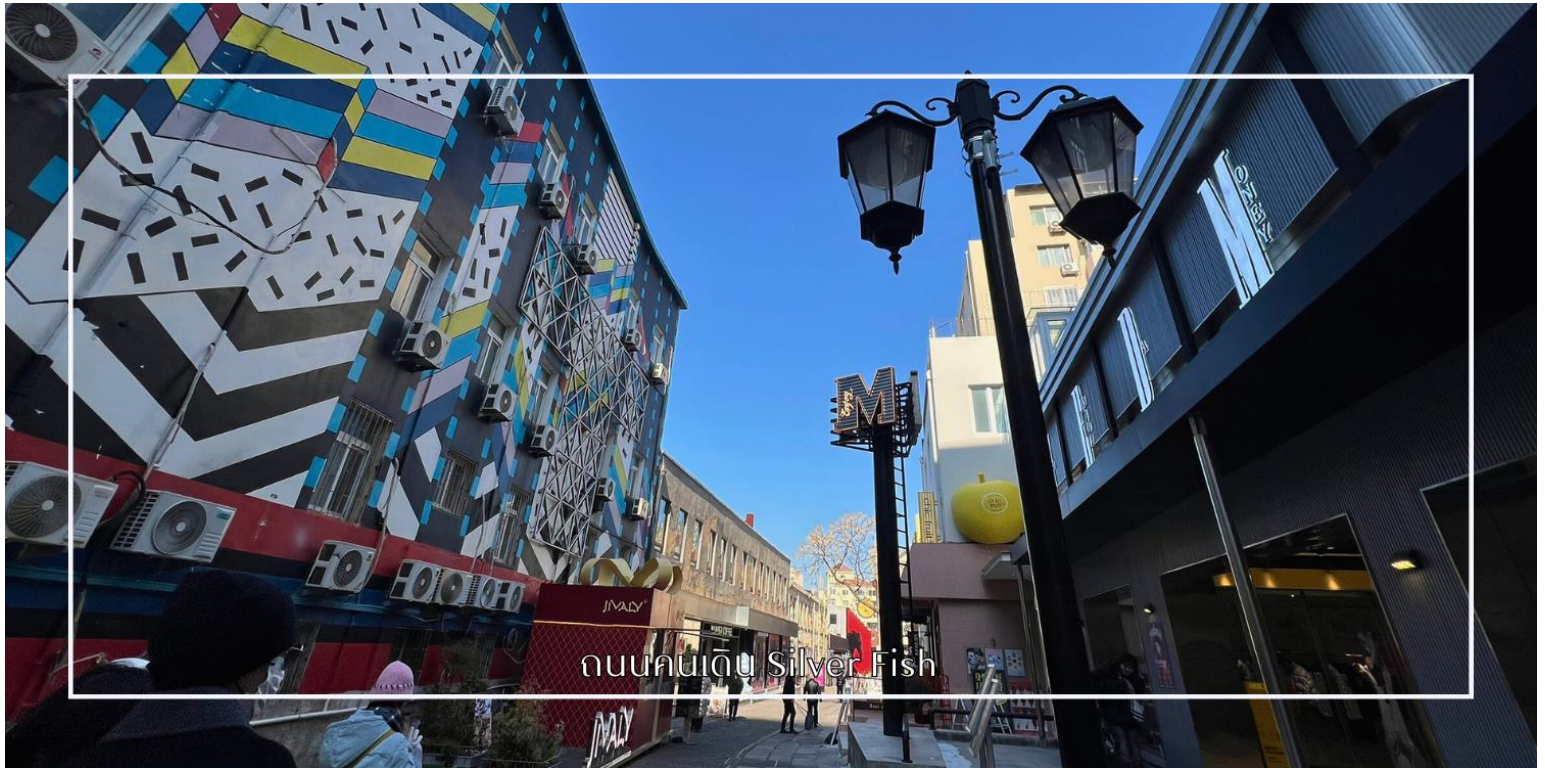
ถนนคนเดิน Silver Fish

สมควรแก่เวลานำท่าน อีสระช้อปปิ้ง ศูนย์การค้า MixC ซิงเต่า หนึ่งในศูนย์การค้าขนาดใหญ่และทันสมัยที่สุดของเมืองซิงเต่า มณฑลซานตง โดดเด่นด้วยการออกแบบสถาปัตยกรรมร่วมสมัยและการรวบรวมแบรนด์ชั้นนำทั้งระดับสากลและท้องถิ่นไว้ในแห่งเดียว ตั้งอยู่ในทำเลศูนย์กลางธุรกิจของเมือง ทำให้สะดวกต่อการเดินทางและเป็นจุดหมายยอดนิยม ภายในศูนย์การค้า MixC มีร้านค้าแฟชั่น เครื่องสำอาง สินค้าไลฟ์สไตล์ และแบรนด์ลักซ์ชัวรีหลากหลาย รวมถึงซูเปอร์มาร์เก็ตระดับพรีเมียม โรงภาพยนตร์ และโซนร้านอาหารนานาชาติที่ตอบโจทย์ทุกความต้องการของผู้มาเยือน บรรยากาศภายในกว้างขวาง โปร่งสบาย และจัดสรรพื้นที่อย่างเป็นระบบ พร้อมให้ท่านอีสระอาหารมือเย็นตามอัธยาศัย