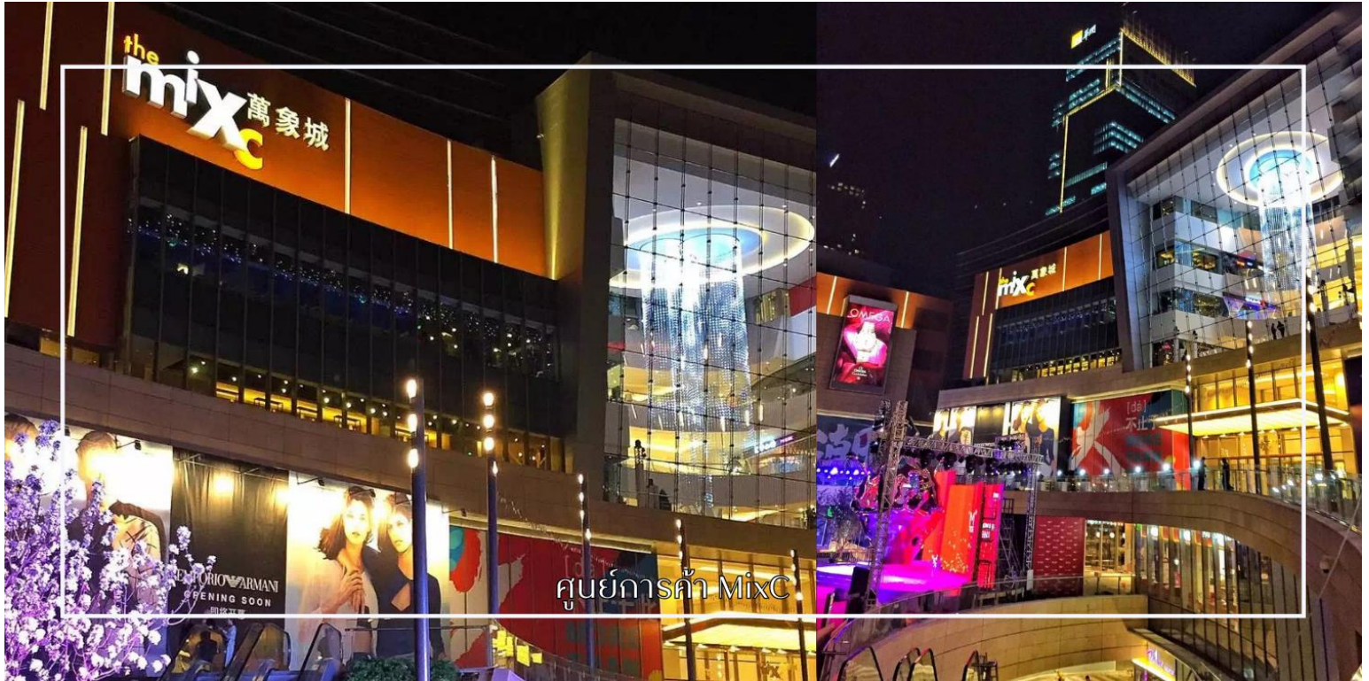
ศูนย์การค้า MixC