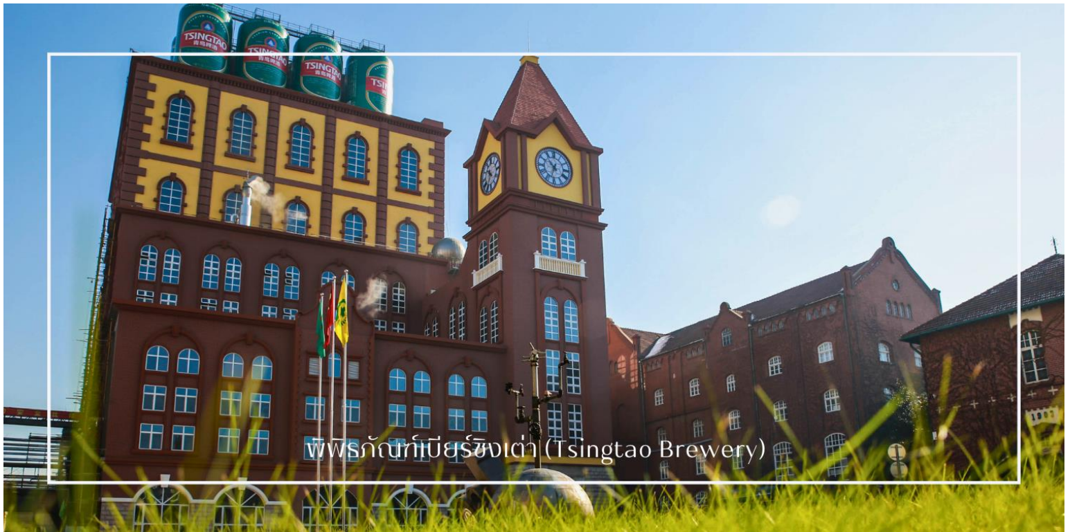
พรมักเกอร์เบียร์ชิงเต่า (Tsingtao Brewery)

นำท่านเยือน โรงเบียร์ชิงเต่า (Tsingtao Brewery) (พิเศษ:ชิมเบียร์ฟรี2แก้ว/ท่าน) สถานที่ก่อตั้งโรงงานเบียร์แห่งแรกของจีน เรียนรู้ประวัติความเป็นมาและกระบวนการพัฒนาตั้งแต่ยุคแรกจนถึงปัจจุบัน ชมกรรมวิธีการกลั่นเบียร์แบบดั้งเดิมและเทคโนโลยีการผลิตสมัยใหม่ที่สุดในโลก พร้อมชม ขบวนการบรรจุเบียร์ลงขวดและกระป๋อง เพื่อจัดจำหน่ายสู่ตลาดโลก และลิ้มรส เบียร์ชิงเต่าที่มีชื่อเสียงระดับโลก