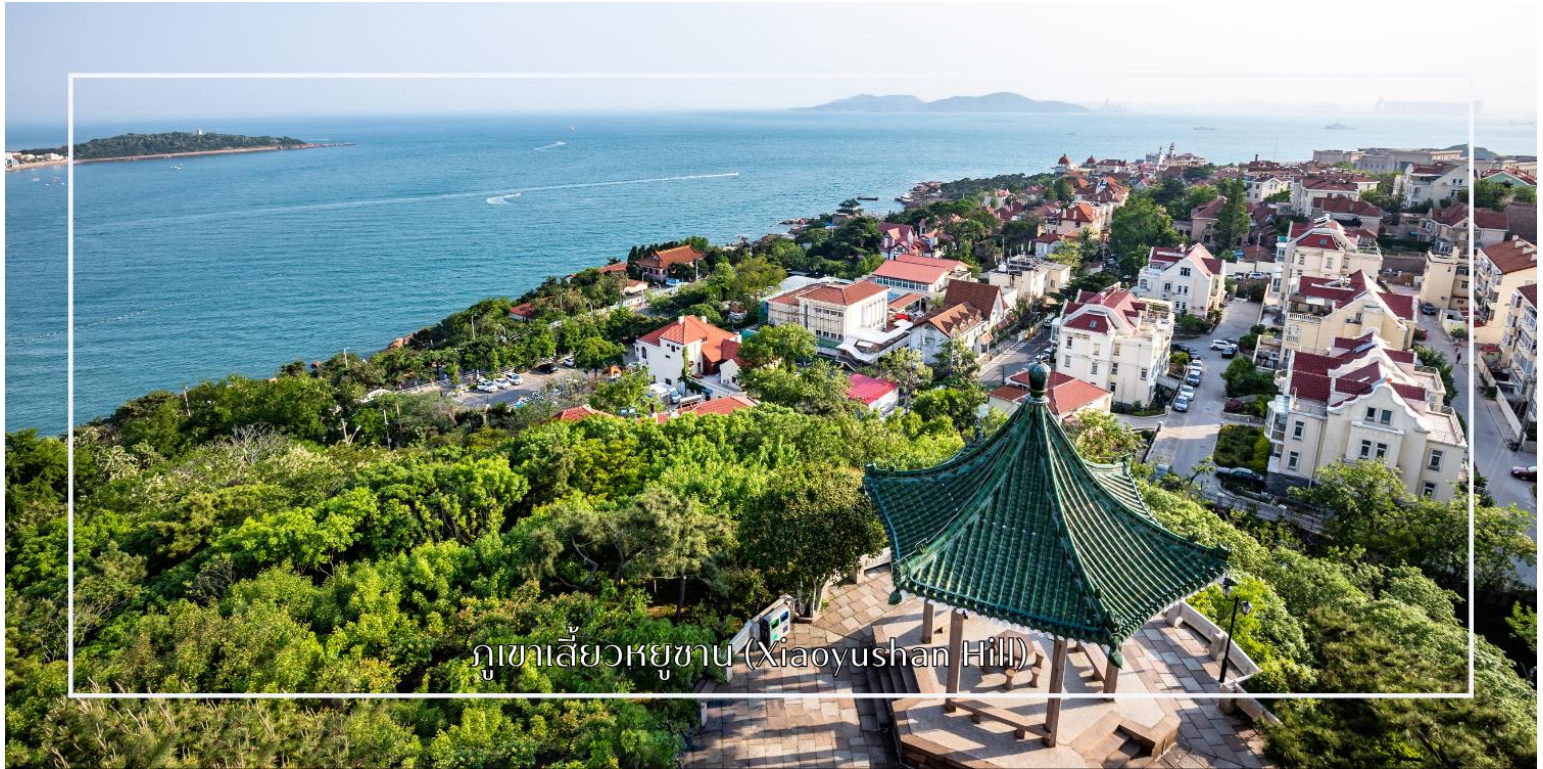
ภูเขาเลี้ยวหยูซาน (Xiaoyushan Hill)

จากนั้นนำท่านเดินเล่น ถ่ายภาพ ถนนหลงเจียง (Longjiang Road) หรือ มักเรียกว่า "ถนนการ์ตูน" หรือ "ถนนอนิเมะ" ที่นี่ถือเป็นสตูดิโอถ่ายรูปที่เหล่าสาวกอนิเมะหลงไหล (สตรีทอาร์ทสตูดิโอจิปี) ย่านเล็กๆ ที่ซ่อนตัวอยู่ท่ามกลางสถาปัตยกรรมยุโรปอันมีเสน่ห์ เต็มไปด้วยตรอกซอกซอยและมุมถ่ายภาพที่ให้บรรยากาศราวกับหลุดออกมาจากโลกแห่งจินตนาการของ สตูดิโอจิปี ผสานความคลาสสิกของอาคารเก่าเข้ากับสีส้มและลวดลายการ์ตูนได้อย่างกลมกลืน เป็นอีกหนึ่งจุดเช็คอินสุดน่ารักที่เหมาะสมสำหรับการเดินเล่น ถ่ายภาพ และเก็บความประทับใจแปลกใหม่ของเมืองชิงเต่า นำท่านแวะเช็คอิน สะพานจ้านเฉียว (Zhanqiao Pier) แลนด์มาร์กสำคัญและสัญลักษณ์ของเมืองชิงเต่า สะพานแห่งนี้ทอดยาวสู่ทะเลจากชายฝั่งใจกลางเมือง สร้างขึ้นตั้งแต่สมัยราชวงศ์ชิง มีความยาวประมาณ 440 เมตร เป็นจุดชมวิวทะเลยอดนิยม ท่านสามารถเพลิดเพลินกับบรรยากาศชายทะเล และวิวอ่าวชิงเต่าอันกว้างไกล อีกทั้งยังเป็นจุดถ่ายภาพยอดนิยมที่มองเห็นภาพเมืองชิงเต่าตัดกับท้องฟ้าและผืนน้ำสีฟ้าได้อย่างสวยงาม