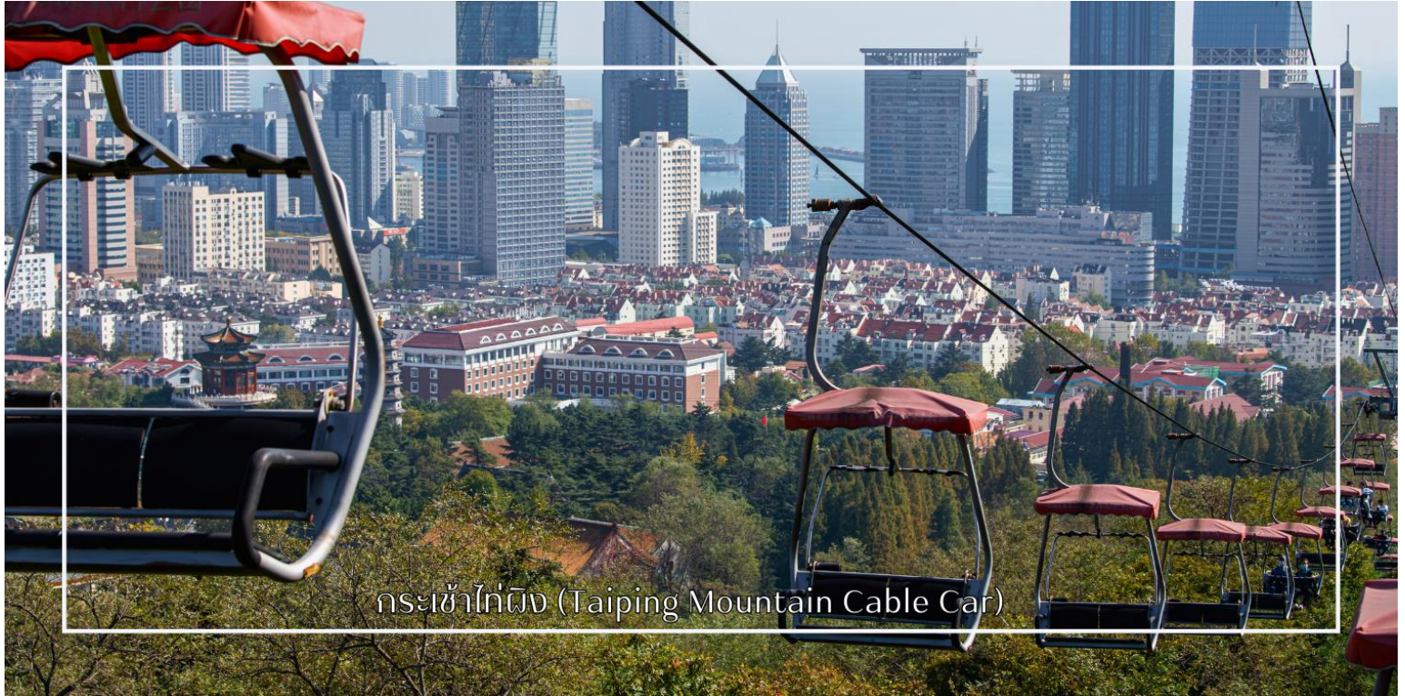
กระเช้าไถ่ผิง (Taiping Mountain Cable Car)

สมควรแก่เวลานำท่านเดินทางสู่สนามบินชิงเต่า