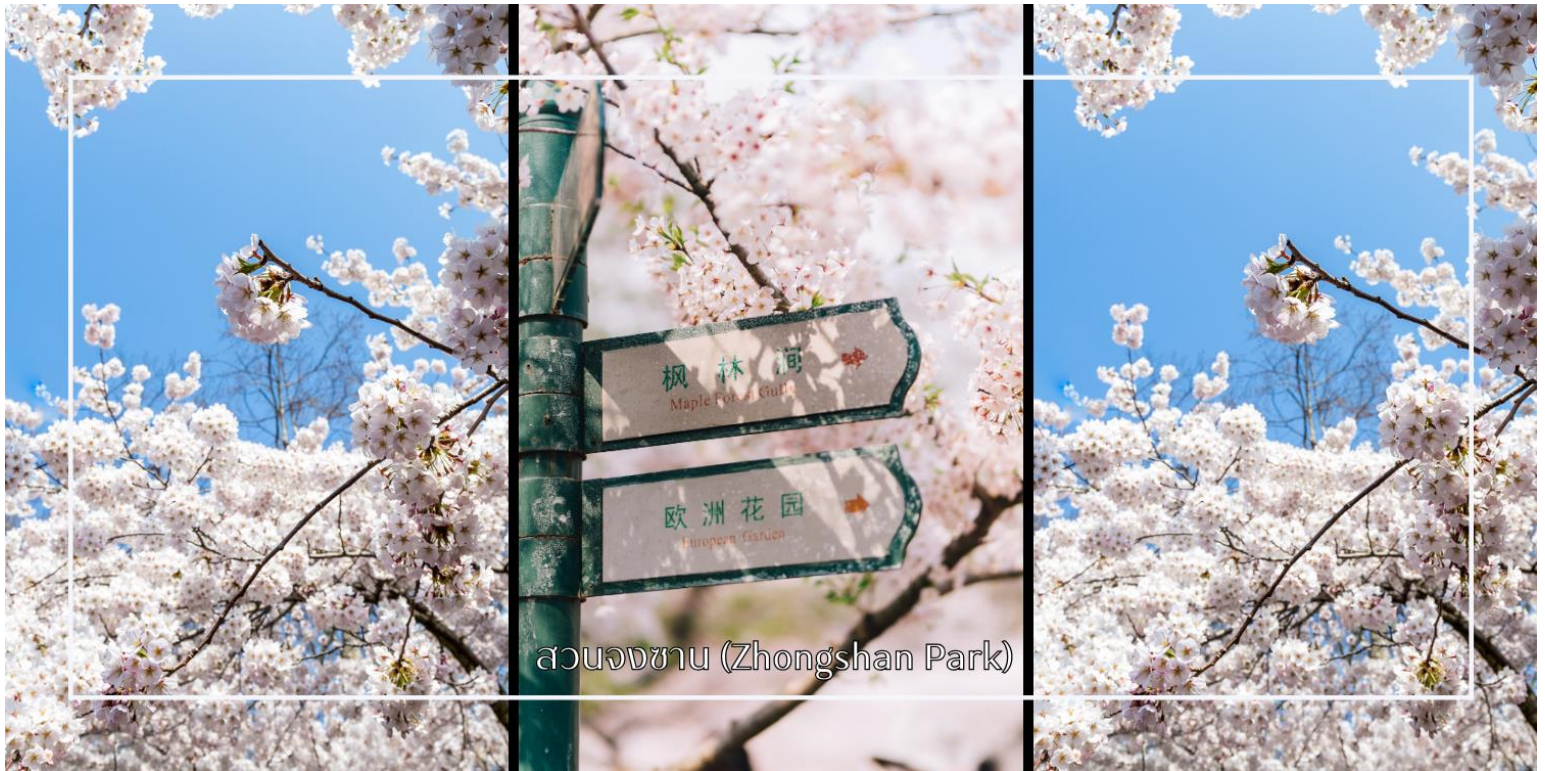
สวนจงชาน (Zhongshan Park)

สวนหม่าชาน (ช่วงเดือนพฤษภาคม) สวนขนาดใหญ่ที่เต็มไปด้วย ดอกกุหลาบกว่า 76,000 ดอก ที่นี้ได้รับการยกย่องว่าเป็นหนึ่งในจุดหมายปลายทางยอดนิยมสำหรับผู้รักธรรมชาติและถ่ายภาพ สวนแห่งนี้จะถูกแต่งแต้มด้วยสีสันสดใสของกุหลาบนานาพันธุ์ ไม่ว่าจะเป็นสีแดงเข้ม สีชมพูหวาน สีเหลืองอ่อน หรือสีขาวบริสุทธิ์ ส่งกลิ่นหอมอบอวลไปทั่วทั้งบริเวณ เส้นทางเดินภายในสวนได้รับการออกแบบอย่างสวยงาม รายล้อมด้วยซุ้มกุหลาบและแปลงดอกไม้ที่จัดวางอย่างประณีต สามารถเพลิดเพลินกับการเดินชมทิวทัศน์ ถ่ายภาพความประทับใจ หรือพักผ่อนท่ามกลางบรรยากาศโรแมนติกสวยงาม