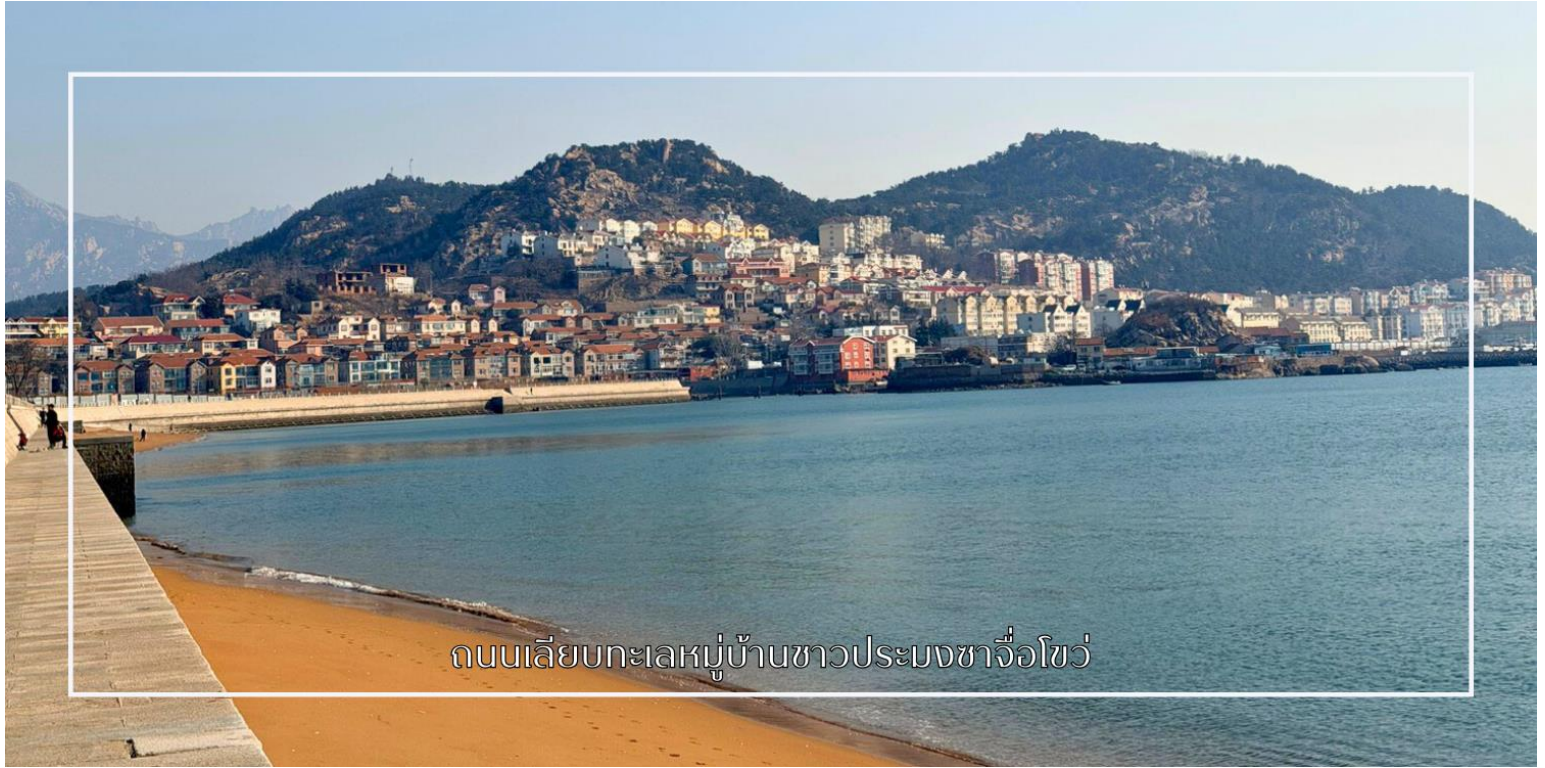
ถนนเลียบกทะเลหมู่บ้านชาวประมงชาวจื่อโซ่ว