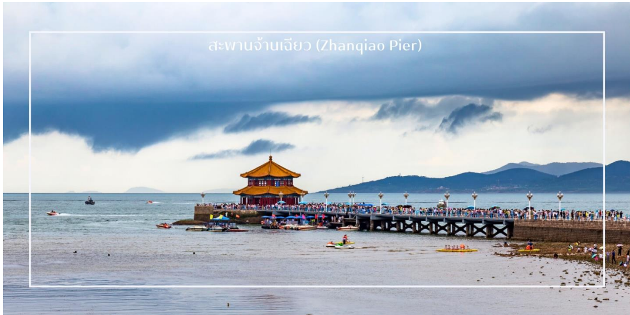
สะพานเจี้ยนเจียว (Zhanqiao Pier)