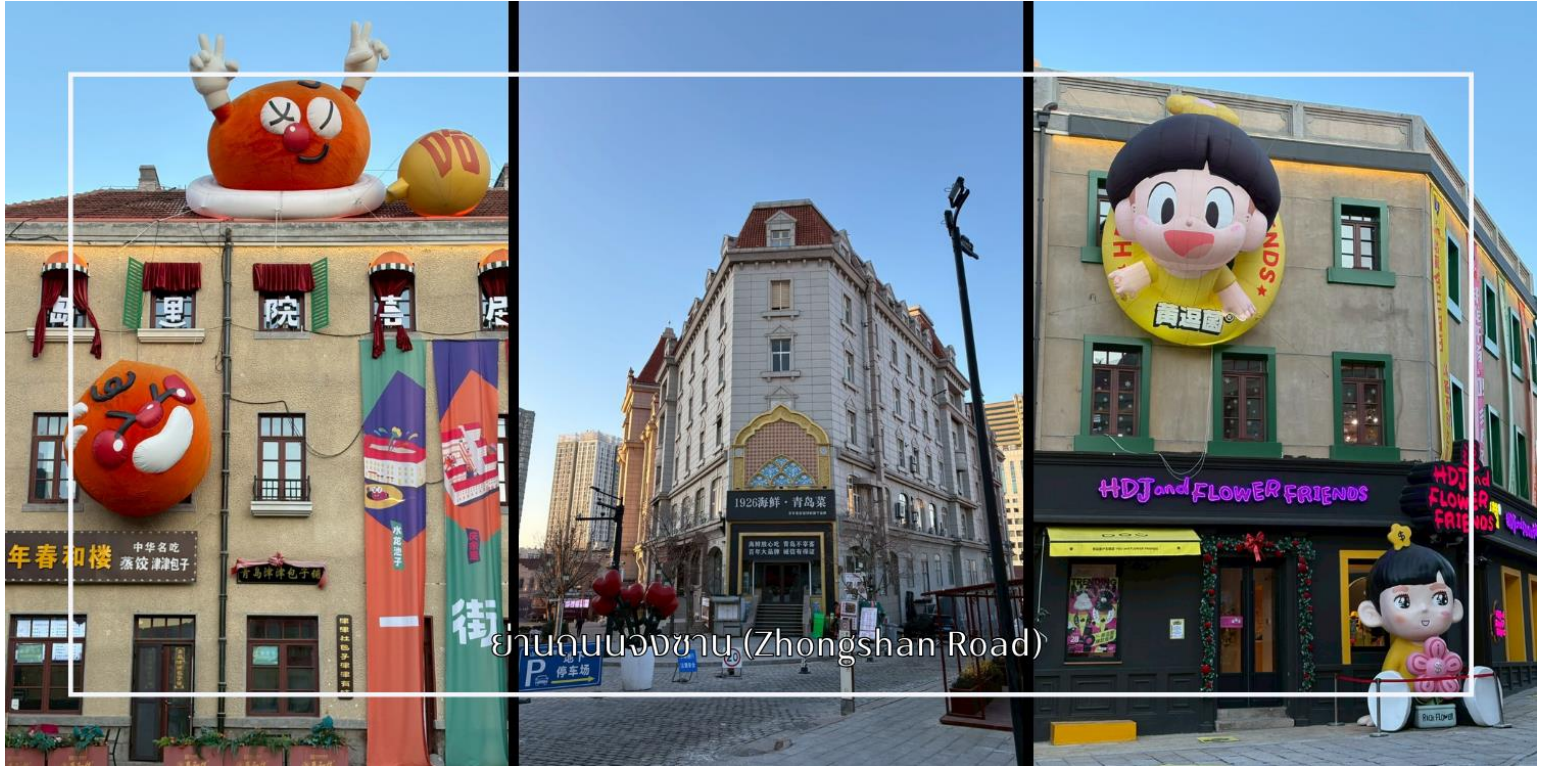
ย่านถนนจงซาน (Zhongshan Road)

ช้อปปิ้งบน ถนนวัฒนธรรมต้าเปาเต่า ถนนสายสำคัญที่ผสมผสาน วัฒนธรรมและประวัติศาสตร์ ได้อย่างลงตัว ภายในมีร้านค้าต่างๆ มากมายให้นักท่องเที่ยวได้เลือกช้อปปิ้ง สถานที่แห่งนี้ได้รับการพัฒนาเป็นแหล่งท่องเที่ยวสำคัญ พร้อมทั้งเป็นย่านการค้าและเขตเศรษฐกิจคึกคัก ของเมืองชิงเต่า เดินชม ซอยยิ่นอวี่ (Yin Yu Alley) ซอยเล็กๆ ที่เต็มไปด้วยเสน่ห์ของเมืองเก่าและวัฒนธรรมท้องถิ่น ชมบ้านเรือนเก่าแก่สไตล์ชิงเต่า ผสมผสานสถาปัตยกรรมแบบเยอรมันและจีนแบบดั้งเดิม พร้อมร้านค้า คาเฟ่ และร้านขายของที่ระลึกบรรยากาศอบอุ่น เหมาะสำหรับการเดินเล่น ถ่ายภาพ และสัมผัสวิถีชีวิตชาวเมืองเก่าอย่างใกล้ชิด