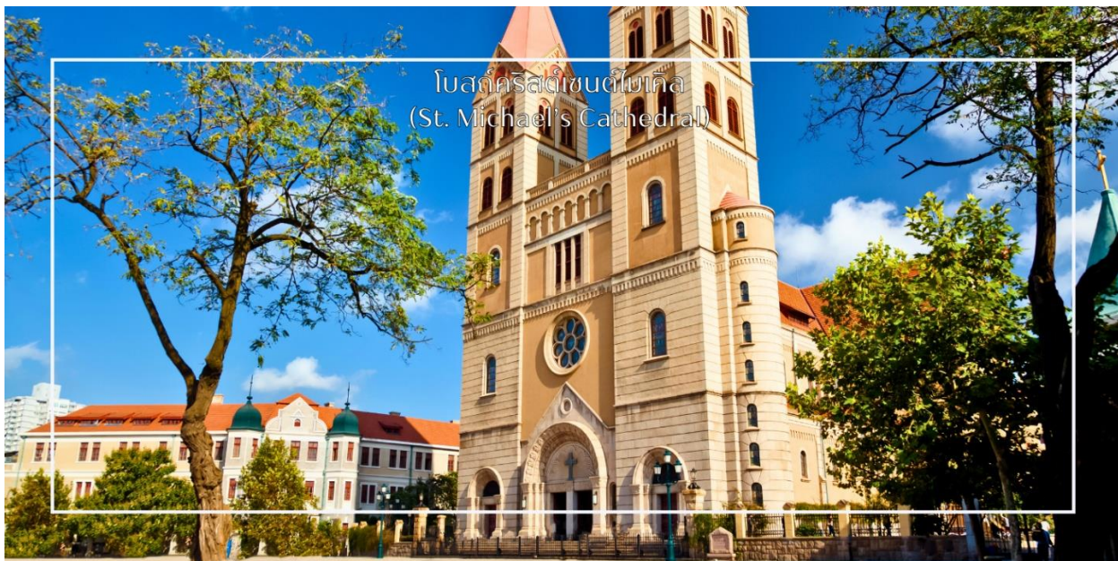
โบสถ์คริสต์เซนต์ไมเคิล (St. Michael's Cathedral)

นำท่านแวะถ่ายภาพ โบสถ์คริสต์เซนต์ไมเคิล (St. Michael's Cathedral) (ชมด้านนอก) หนึ่งในสถาปัตยกรรมสำคัญสร้างขึ้นโดยมิชชันนารีชาวเยอรมันในสมัยอาณานิคม มีรูปแบบสถาปัตยกรรมโกธิกอันวิจิตรงดงาม โดดเด่นด้วยหอคู่อัฐีสีแดงและหน้าต่างกระจกสีที่สะท้อนแสงแดดอย่างสวยงาม โบสถ์แห่งนี้เปรียบเสมือนเครื่องหมายแห่งศรัทธาและเป็นจุดถ่ายภาพยอดนิยม