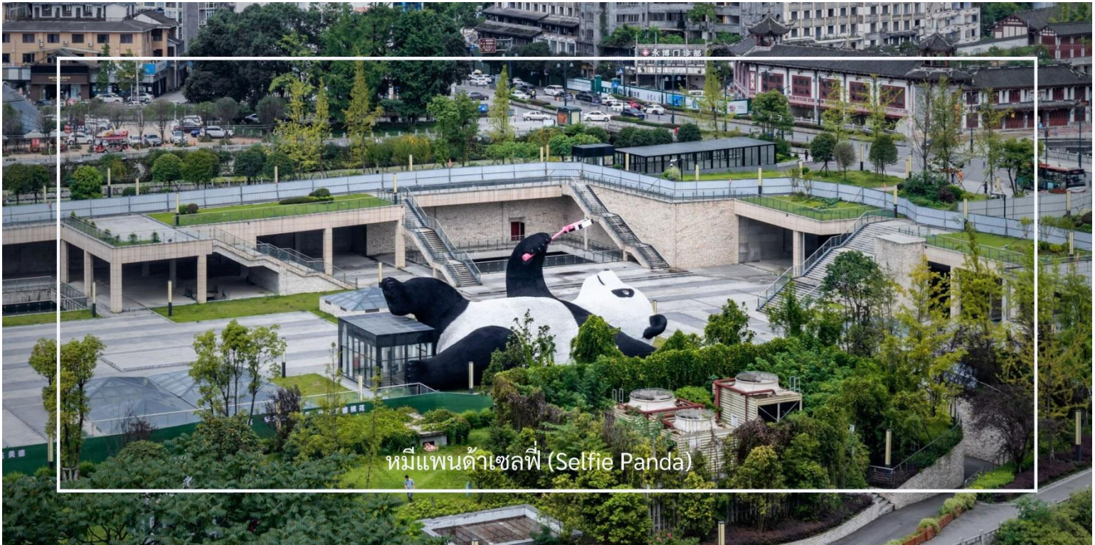
หมิป้านต้าเซลฟี (Selfie Panda)

หลังรับประทานอาหารเช้าเดินทางสู่อีก 1 จุดเช็คอิน ที่ไม่ควรพลาดของเมืองตูเจียงเยียน จัตุรัสหย่างเทียนวู (Yangtianwo Square) เป็นจุดถ่ายรูปยอดนิยมซึ่งท่านจะได้ชมประติมากรรมรูปปั้น หมิป้านต้าเซลฟี (Selfie Panda) หมิป้านต้าตัวใหญ่ที่กำลังนอนหงายเซลฟี ณ ใจกลางจัตุรัสหย่างเทียนวู เป็นภาพแสนน่ารักช้ออันจนทำให้เราหลงไหลและไม่พลาดที่จะถ่ายรูปคู่เป็นที่ระลึก จากนั้นออกเดินทางสู่ เมืองเฉิงตู (ใช้เวลาเดินทางประมาณ 1 ชั่วโมง)