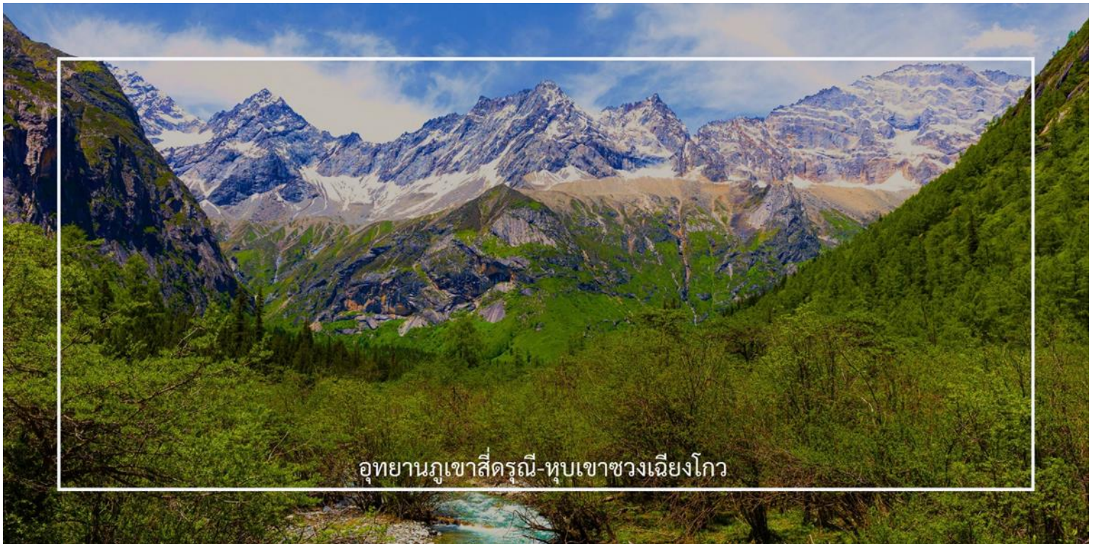
อุทยานภูเขาซีตรูณี-หุบเขาซวงเฉียวโกว

นำท่านชมเส้นทางไฮไลท์ หุบเขาซวงเฉียวโกว (Shuangqiaogou Valley) (รวมรถอุทยาน) เป็นหนึ่งในสถานที่ท่องเที่ยวที่สวยงามที่สุดของอุทยานภูเขาซีตรูณี เดินทางง่ายและสะดวกที่สุด เราจะเดินทางเข้าไปยังจุดที่ลึกที่สุด และค่อย ๆ นั่งรถเที่ยวออกมาตามจุดต่าง ๆ เส้นทางนี้รวมจุดสำคัญหลายอย่างไว้ด้วยกัน ทั้งภูเขาที่สูงตระหง่านและปกคลุมไปด้วยหิมะในฤดูหนาว พุ่มหญ้าเขียวขจีในฤดูใบไม้ผลิและฤดูร้อน หรือเห็นธารน้ำแข็งและทะเลสาบต่างๆ ทำให้คุณได้สัมผัสกับความงดงามของธรรมชาติในทุกฤดูกาลได้แบบ 360 องศา