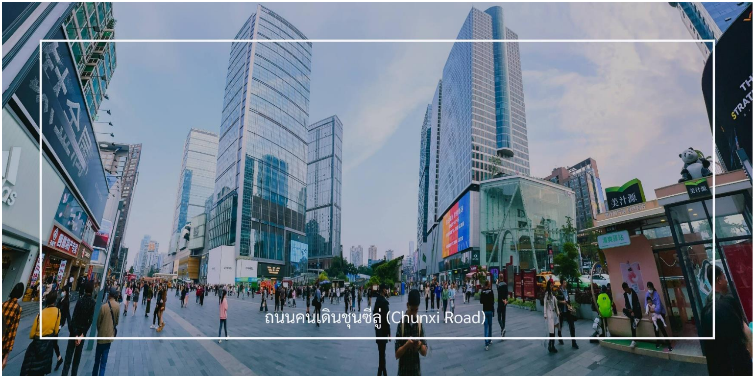
ถนนคนเดินชุนซีลู่ (Chunxi Road)

เดินข้ามถนนมาอีกหน่อย ท่านจะได้ซื้อป๊อง ถนนคนเดินชุนซีลู่ (Chunxi Road) เต็มไปด้วยร้านค้าแบรนด์ชั้นนำทั้งในและต่างประเทศ รวมถึงร้านเสื้อผ้าแฟชั่น รองเท้า อุปกรณ์อิเล็กทรอนิกส์ และของฝาก ถนนคนเดินชุนซีลู่เป็นจุดที่มีความคึกคักและเต็มไปด้วยผู้คน โดยเฉพาะในช่วงวันหยุดสุดสัปดาห์และเทศกาลต่างๆ คุณจะได้พบกับการแสดงศิลปะ การแสดงดนตรี และกิจกรรมที่น่าสนใจ มีร้านอาหารมากมายที่เสนาอาหารท้องถิ่นและขนมหวานที่หลากหลาย นักท่องเที่ยวสามารถลิ้มลองเมนูพื้นเมืองที่อร่อย เช่น เสี่ยวหลงเปา (ซาลาเปานึ่ง) หรือขนมโบราณตามรอยซีรี่ย์จีนอย่าง มาไลโกว ก็มีเช่นกัน