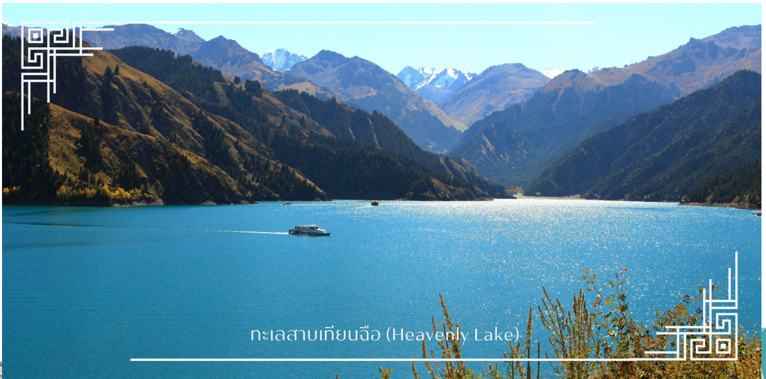
ทะเลสาบเทียนฉือ (Heavenly Lake)

นำท่าน ล่องเรือทะเลสาบเทียนฉือ (Heavenly Lake) ทะเลสาบน้ำจืดใสสะอาดราวกับกระจกเงา ท่ามกลางบรรยากาศเงียบสงบและอากาศอันบริสุทธิ์ ท่านจะได้ชมความยิ่งใหญ่ของยอดเขาที่สะท้อนเงาลงบนผืนน้ำสีมรกตอย่างใกล้ชิด มอบความรู้สึกที่ผ่อนคลายและประทับใจราวกับได้หลุดเข้าไปอยู่ในภาพวาดทิวทัศน์ระดับโลก (รวมค่าล่องเรือ)