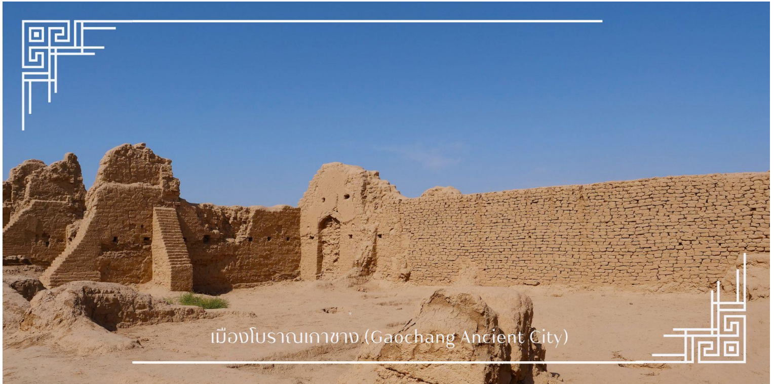
เมืองโบราณเกาชาง (Gaochang Ancient City)

นำท่านผ่านชม ภูเขาเปลวไฟ เป็นทิวเขาทรายสีแดงที่ร้อนที่สุดในจีน ขึ้นชื่อจากตำนานไซอิ๋วและวิวทิวทัศน์คล้ายดาวอังคาร ที่สวยแปลกตา ภูเขาทอดยาวเต็มไปด้วยหินสีแดงจัดเมื่อสะท้อนแสงแดดจะดูเหมือนเปลวเพลิง