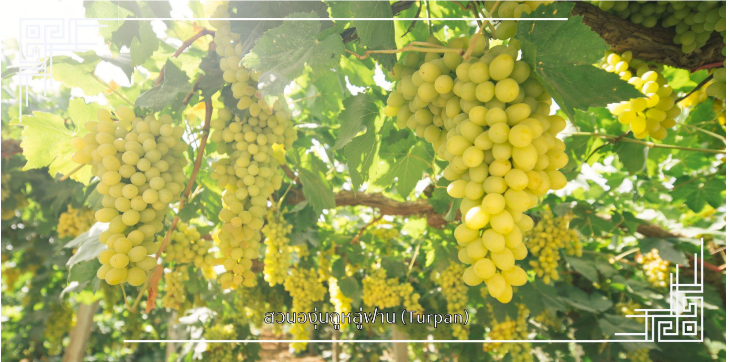
สวนองุ่นกุหลาบ (Turpan)

นำท่านแวะชม สวนองุ่น (มีเฉพาะเดือนมิถุนายน-สิงหาคม) แหล่งผลิตองุ่นไร้เมล็ดที่หวานและใหญ่ที่สุดของจีน ในหุบเขาที่ ร่มรื่นไปด้วยเถาองุ่นสีเขียวขจี ท่ามกลางบรรยากาศร่มรื่นกลางทะเลทราย