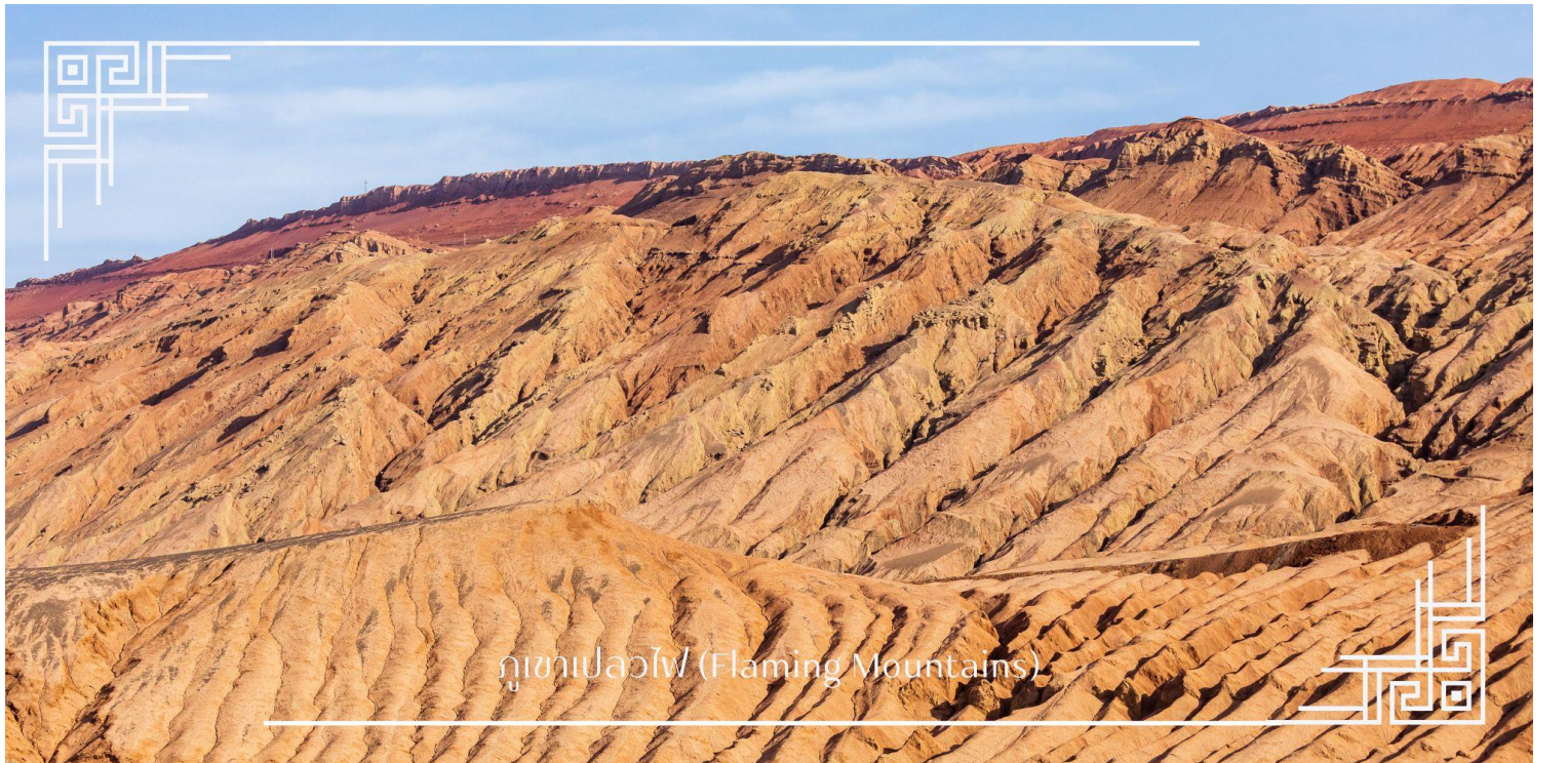
ภูเขาเปลวไฟ (Flaming Mountains)

นำท่านผ่านชม ภูเขาเปลวไฟ เป็นทิวเขาทรายสีแดงที่ร้อนที่สุดในจีน ขึ้นชื่อจากตำนานไซอิ๋วและวิวทิวทัศน์คล้ายดาวอังคาร ที่สวยแปลกตา ภูเขาทอดยาวเต็มไปด้วยหินสีแดงจัดเมื่อสะท้อนแสงแดดจะดูเหมือนเปลวเพลิง