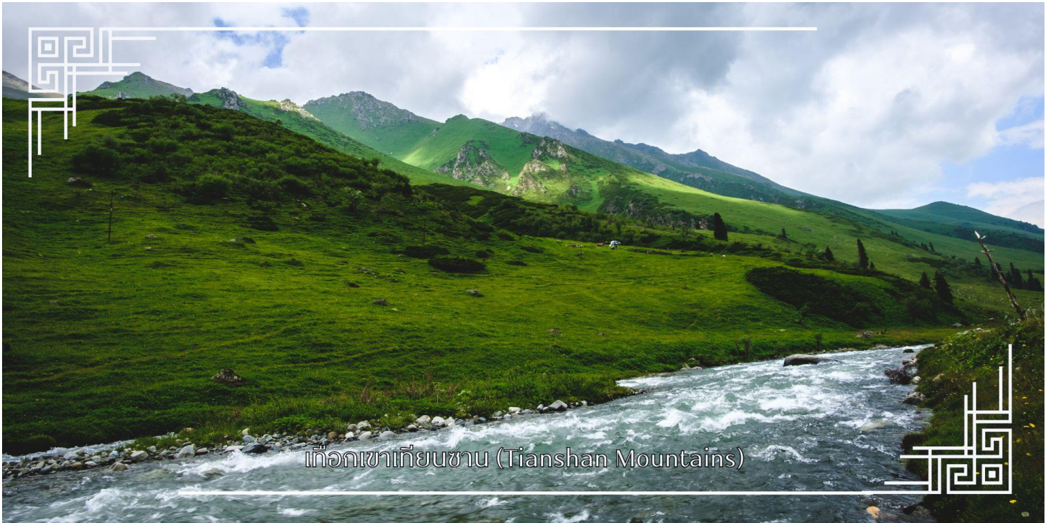
เทือกเขาเทียนชาน (Tianshan Mountains)