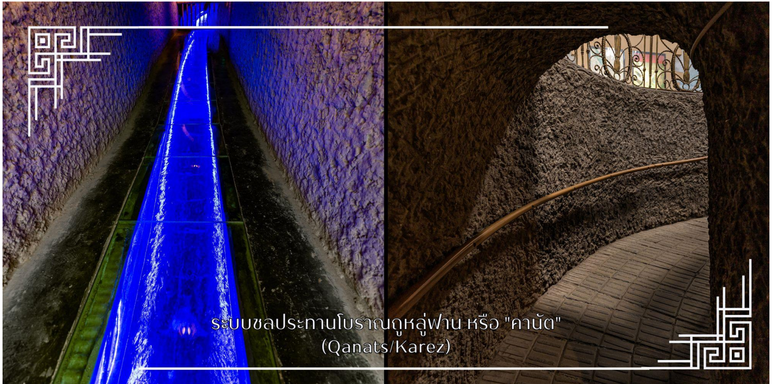
ระบบชลประทานโบราณคูหลูฟาน หรือ “คานัต” (Qanats/Karez)

ระบบชลประทานโบราณคูหลูฟาน หรือ “คานัต” เป็นระบบส่งน้ำใต้ดิน ในเขตซินเจียง ประเทศจีน ใช้ภูมิปัญญาขุดอุโมงค์ ใต้ดินเชื่อมต่อกัน เพื่อนำน้ำจากหิมะละลายบนภูเขามาใช้ในโอเอซิสทะเลทราย ลดการระเหยของน้ำ ทำให้เมืองคูหลูฟาน อุดมสมบูรณ์และเป็นแหล่งปลูกองุ่นขึ้นชื่อ