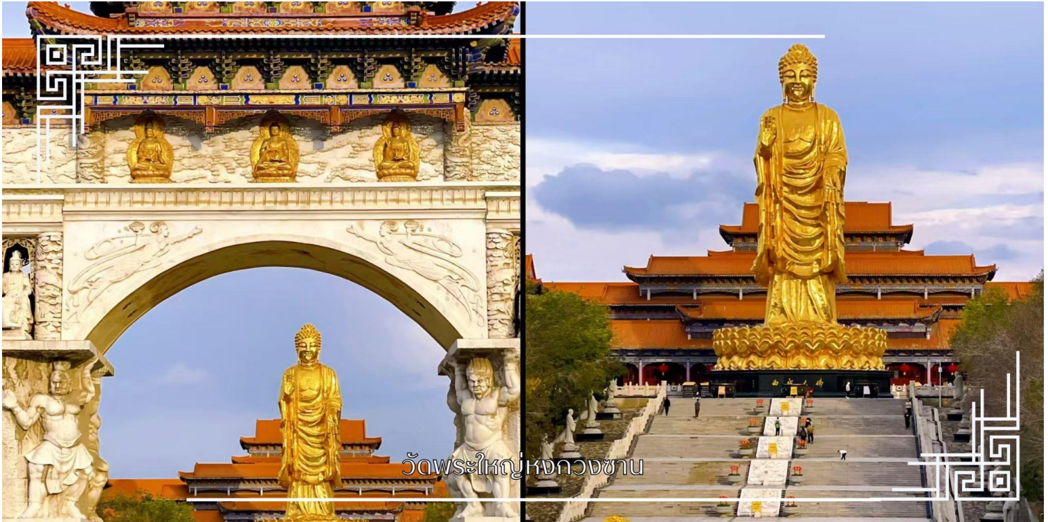
วัดพระใหญ่หงกวงซาน

หมายเหตุ : การล่องเรือเปิดให้บริการเฉพาะในช่วงเดือนพฤษภาคม – กันยายน ของทุกปี สำหรับเดือนเมษายน จะงดให้บริการล่องเรือ ทางบริษัทฯ ขอคืนเงินให้ท่านละ 450 บาท และปรับเปลี่ยนรายการนำท่านเดินทางไปสักการะพระใหญ่ ณ วัดพระใหญ่หงกวงซาน แทน