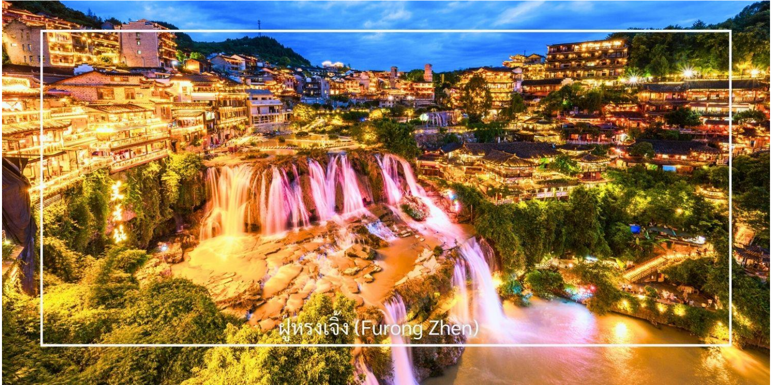
ฝูหรงเจิ้ง (Furong Zhen)

ท่านสามารถเลือกซื้อบริการเสริม (Option) เพิ่มเติมได้: ถ้ามังกรเหลือง (รวมล่องเรือชมแสงสีในถ้ำ ราคา 350หยวน/ท่าน)