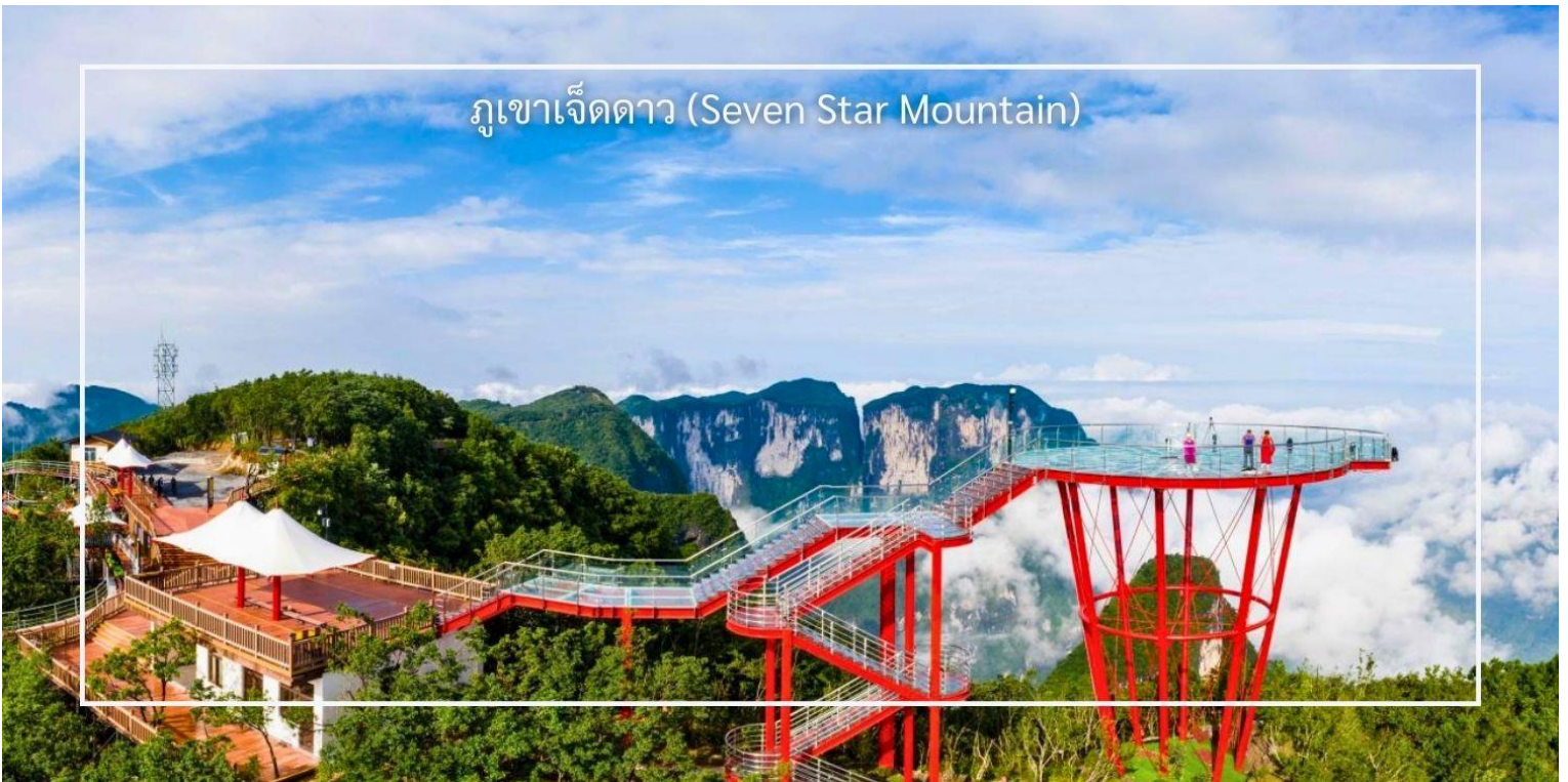
ภูเขาเจ็ดดาว (Seven Star Mountain)

แวะชม ร้านสินค้าผลิตภัณฑ์ยางพารา เลือกซื้อสินค้าเพื่อสุขภาพ อาทิ หมอนยางพารา ที่นอน และผลิตภัณฑ์จากยาง ธรรมชาติ สัมผัสวิมมุมสูงสุดตระการตาของธรรมชาติที่ ภูเขาเจ็ดดาว(Seven Star Mountain) สามารถมองเห็น ทัศนียภาพของ เทียนเหมินซาน ได้อย่างชัดเจน เป็นอีกหนึ่งสถานที่ที่ผสมผสานความยิ่งใหญ่ของธรรมชาติเข้ากับเสน่ห์ทาง วัฒนธรรมจีนได้อย่างลงตัว ชมวิวกุหาสลัซซันแบบพาโนรามา ณ จุดชมวิว “Sky Eye” ที่เปิดมุมมองจากที่สูง ให้เห็น ผืนป่าและแนวเขา ไม่ควรพลาดกับการเดินบน ระเบียงแก้ว สะพานกระจกลอยฟ้า ทางเดินพื้นกระจกสีแดงที่ทอดยาวเลียบบน หน้าผาสูงชัน เป็นจุดเช็คอินยอดนิยม จากความสูงกว่า 1,500 เมตร