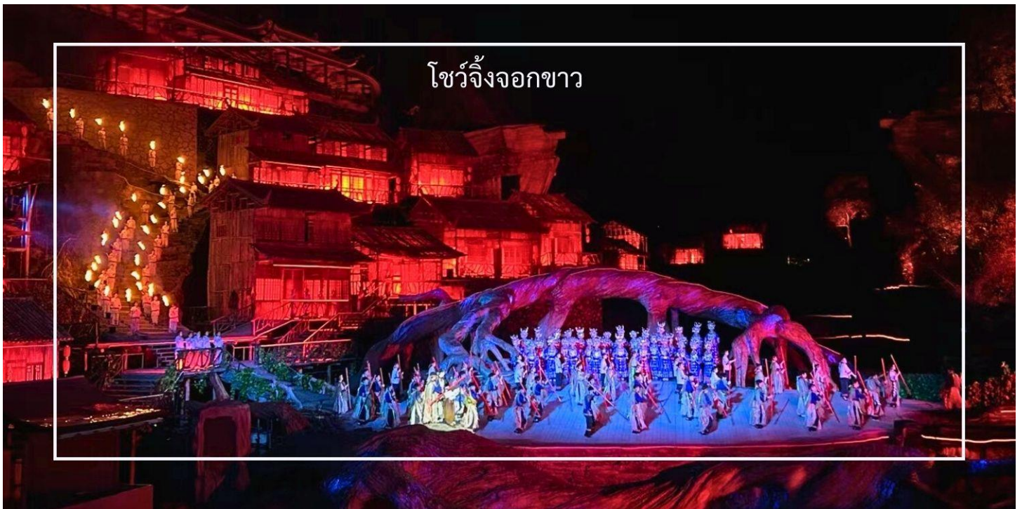
โชว์จิ้งจอกขาว

ร่วมสัมผัสประสบการณ์การแสดงระดับโลกกับ The White Fox Show การแสดงกลางแจ้งสุดตระการตาที่ผสมผสานศิลปะการแสดง แสง สี เสียง และเทคนิคมัลติมีเดียล้ำสมัยเข้าไว้ด้วยกันอย่างสวยงาม การแสดงจัดขึ้นท่ามกลางฉากธรรมชาติอันยิ่งใหญ่ ซึ่งที่นี่ได้รับการขนานนามว่าเป็นหนึ่งในเวทีธรรมชาติที่สวยงามที่สุดแห่งหนึ่งของโลก ไฮไลท์ของการแสดงคือ การถ่ายทอดเรื่องราวตำนานรักแสนโรแมนติกระหว่างมนุษย์กับจิ้งจอกขาวได้อย่างซาบซึ้งตรึงใจ ผ่านนักแสดงนับร้อยชีวิต พร้อมเครื่องแต่งกายที่วิจิตรงดงาม