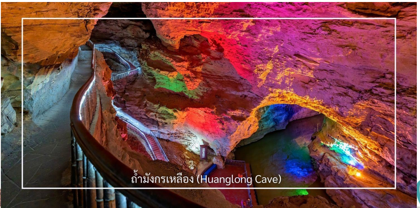
ถ้ามังกรเหลือง (Huanglong Cave)

ถ้ามังกรเหลือง หนึ่งในถ้ำหินงอกหินย้อยที่ยิ่งใหญ่และงดงามที่สุดของเมืองจางเจียเจี๋ย แหล่งท่องเที่ยวทางธรรมชาติที่ได้รับการยกย่องว่าเป็น “พระราชวังใต้พิภพ” แห่งดินแดนอุ่หลิงหยวน ถ้ำแห่งนี้มีโครงสร้างขนาดใหญ่ แบ่งออกเป็น 4 ชั้น ภายในประกอบด้วยห้องโถงกว้างใหญ่ ลำธารใต้ดิน บึงธรรมชาติ และแนวระเบียงหินที่ทอดยาวอย่างน่าตื่นตา ความมหัศจรรย์ของ