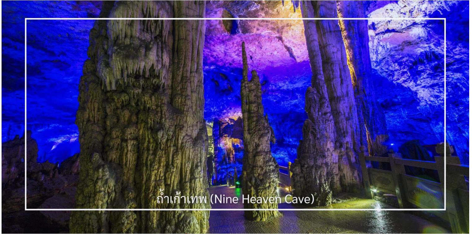
ถ้ำเก้าเทพ (Nine Heaven Cave)