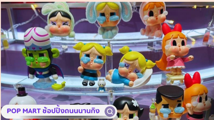
POP MART ช้อปฝั่งถนนนานกิง 🔍

จากนั้นอิสระท่านเฟลิดเฟลินที่ ถนนนานจิง(NANJING ROAD) เป็นย่านช้อปปิ้งเก่าแก่ที่สุดของเซี่ยงไฮ้ เป็นตลาดซื้อขายของกันคึกคักตั้งแต่ทศวรรษ 1920 ตั้งอยู่ฝั่งผู้ซีกินพื้นที่ยาวตั้งแต่ฝั่งตะวันตกของ “เดอะ บันด์” ถึง “ทีเฟิลส์ สแควร์” เป็นแหล่งช้อปปิ้งสินค้าแบรนด์เนมจากทั่วโลก และยังเป็นศูนย์รวมร้านค้าและร้านอาหารอีกมากมาย และพลาดไม่ได้กับนักจุ่มอาร์ททอยอย่าง แบรินด์ POPMART GLOBAL FLAGSHIP STORE ร้านขายของเล่นที่เป็นที่โด่งดังในขณะนี้ไม่ว่าจะ LABUBU MOLLY SKULLPANDA และอย่างอื่นอีกมากมาย ให้ท่านได้เลือกลุ้นกันอย่างสนุกสนาน