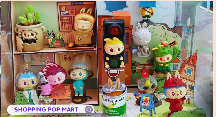
SHOPPING POP MART 🔍

ค่ำ รับประทานอาหารค่ำ ณ ภัตตาคาร (มื้อที่ 2)