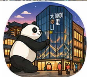
ถนนคนเดินไท่กู่หลี่ (Taikoo Li)

จากนั้นอิสระท่าน ถนนคนเดินชุนซีหลู่ ย่านช้อปปิ้งชื่อดังและคึกคักที่สุดของเฉิงตู เต็มไปด้วยห้างสรรพสินค้า ร้านแบรนด์ดัง ร้านอาหาร และสตรีทฟู้ด เหมาะสำหรับช้อปปิ้งและสัมผัสวิถีชีวิตคนเมือง และ ถนนคนเดินไท่กู่หลี่ แหล่งช้อปปิ้งไลฟ์สไตล์สุดทันสมัย ผสมผสานสถาปัตยกรรมจีนโบราณกับดีไซน์โมเดิร์นอย่างลงตัว รายล้อมด้วยร้านค้าแบรนด์ดัง คาเฟ่ และมุมถ่ายรูปสวยๆ มากมาย